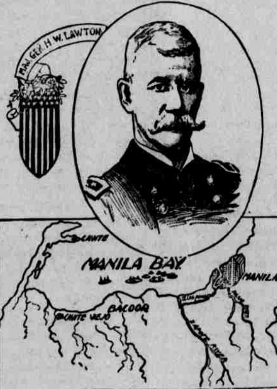
GENERÁL LAWTON A JEHO OPERACE V CAVITE. Provincie Cavite, již od Manila se rozprostírající jest operačním místem generála Lawtona, odtud činěny byly časté výpady na Filipince až k řece Zapote. Nyní povstalci ustoupili do vnitrozemí, kde seřadují nové velké oddíly vojáka

V době nejhorší. Ale jak pochodili Němci — jak Češi? Nu, to je nejcharakterističtější. Němci, kteří nasadili všechny páky, aby Thuna a Kaizla pochovávali a kteří za ten funus dávali celé vyrovnání bez podmínky, ti pochodili nejhůře, neboť Thun i Kaizl sedí pevně dál a ve vyrovnání získán úspěch. Proto Němci nyní zuří.