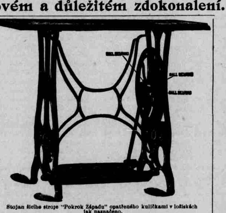
Stojan šicích stroje "Pokrok Zápádu" opatřeného kuličkami v ložiskách jak naznačeno.