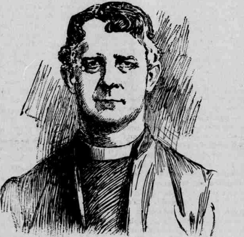
BISKUP CHESTERSKÝ V ANGLII.

Ku stávkce v Českých Budějovicích. — Stávka stavebních dělníků v Českých Budějovicích provázena byla bouřlivými výstupy a srážkami s policií a vojskem, při nichž i krev prolila. Kdo to zavinil, nelze na určito tvrditi, neboť vyšetřování není ukončeno. Avšak jest třeba ukázati na jednání budějovické městské policie, která svým bezohledným vystupováním nejen proti stávkujícím, ale i proti obecnstvu vůbec podala nejpádlnější důkaz, že k funkci, ku které jest určena, vůbec schopna není, a že tam, kde jejím úkolem jest zjednati klid, svým vystupováním jako vždy, když má před sebou člověka zuboženého neb Čecha vůbec, leje jenom olej do ohně a zavádá podnět k výstupům a bouřím, při nichž ovšem pak veliký počet osob zatkae a vsadí za mříže.