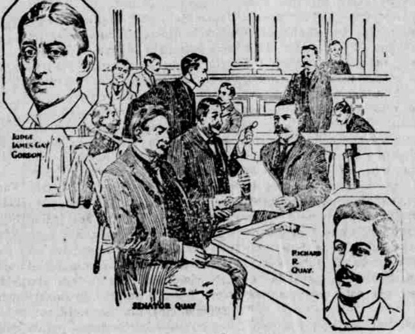
SENATOR QUAY PŘED SOUDEM. Málo soudů v posledních letech poutalo k sobě tak značnou a všeobecnou téměř pozornost jako soud se spolkořím senátorem M. S. Quayem...