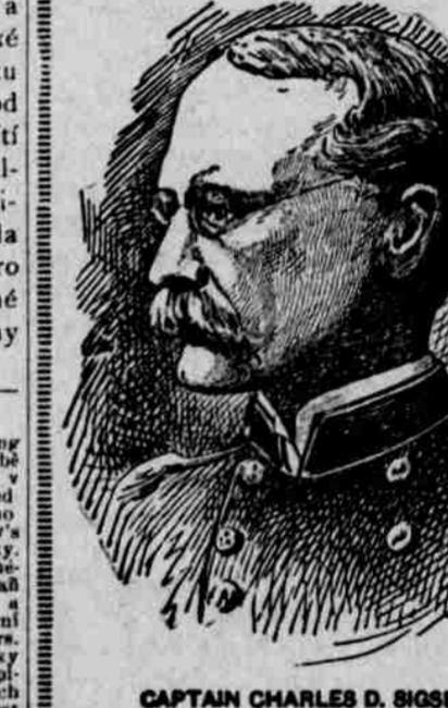
CAPTAIN CHARLES D. SIGSBE

J SOUCE přesvědčení, že mnozí z čtenářů našich přejí si zachovati na památku vše, co vztahuje se k této památné udalosti, zaopatřili jsme toto válečné album, kterěz doplño- vati bude "Dějiny války", jež odběratelům co premi nabízíme a pčzůstávati bude z osmi sešitů a sice jak následuje: