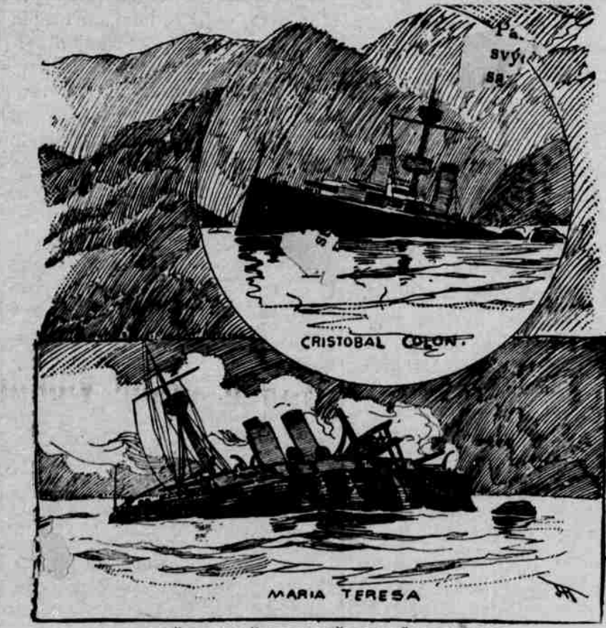
OBĚTI NAŠEHO DĚLOSTŘELECTVA.

Česká veselost; sbírka původ. humoristických zpěvů a scén pro dva tři i více hlasů s průvodem piana. Sbírkou tuto ředitel svého druhu, můžeme vřele doporučit ct. spolům zábavním a ochotnickým, neboť obsahuje hojnost příhodných komických výstupů k zábavám, be-