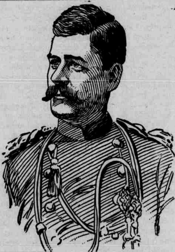
BRIGÁDNÍK HENRY W. LAWTON

musí skončiti porážkou vlády Rudiniovy. Všecky strany levice, i mírné, zděsily se reakcionářských cest, na něž konservativce tento, jindy tak střízlivý, zbloudil po revolučních dějích z týdnů posledních a pochopily jasně, že k odvrácení revolučního hnutí v Italii nijak nepomohou výminečné zákony, nýbrž především odstranění oprávněných důvodů nespokojenosti mass lidových. Když pak Zanardelli, vůdce jedné skupiny liberální, jenž byl nedávno z ministerstva Rudinova právě pro nesouhlas s reakcionářskými předlohami jeho vystoupil, svolal po sezení sněmovním schůzi frakce té a když v této 72 stoupenců Zanardellových rozhodlo se hlasovati v příští schůzi pro resoluci, kterou se reakcionářský postup vlády odsuzuje, nemohlo být již o výsledku hlasování pochyby. Počítalo se, že bude míti vláda na své straně 150, opposice ale 210 hlasů. Rudini rozhodl se hlasování nevyčkáti. Hned na počátku schůze sněmovní, jež zahájena byla za velkého vzrušení, oznámil ministrpresident markýz Rudini, že ministerstvo vzhledem k parlamentní situaci a aby nepraesudikovalo obtížné otázky zachování veřejného pořádku, podalo demissi v ruce královny.