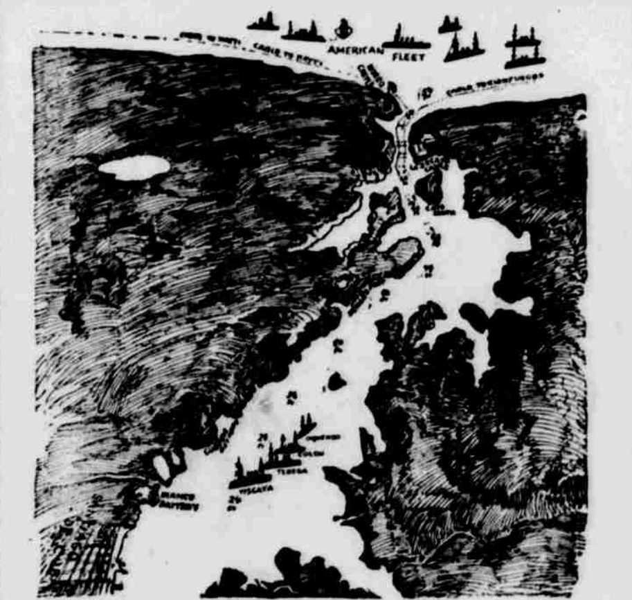
"LÁHEV" SANTIAGSKÁ. Vyobrazení přístavu santiagského, jež tuto podáváme, objasňuje nejlépe, proč nyní říká se, že loďstvo španělské jest v něm "zaláhováno." Vjezd do přístavu jest velice úzkým, neboť v čase války, kdy četné miny položeny jsou, měří sotva 100 stfevů.

Dodge.—Korna místy musí znovu vysazována býti; jinde stojí