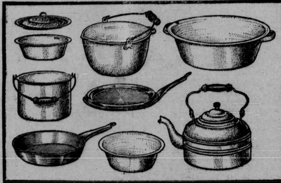
This is the Enamel Ware we give away

It consists of nine large pieces and will be given away Absolutely Free with every range sold during the demonstration only.