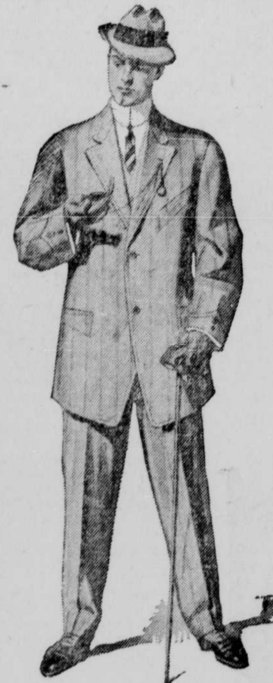
Made by Felix Rothschild & Co. Vo-to-date Clothiers CHICAGO

hat soeben eine große Sendung von Damen und Mädchen Kleider Röcke erhalten für das Frühjahrs Geschäft worin alle Farben zum Vorschein kommen und zwar in den verschiedensten neuen Mustern. Auch haben wir ein umfangreiches Lager Waists jedes Modells welche wir am Samstag zum Verkauf darbieten. Ihr könnt das Gewünschte hier finden zum Preise 50c bis $7.50 Eine größere Auswahl wurde nie hier gezeigt