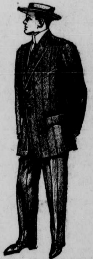
“MODERN CLOTHES” Dresses, Suits, Hats Brantice Kincaid & Co.

Damen geschneiderte Suits Capes Damen-Röcke Damen feine Kleider-Röcke und Shirt Waists. Männer-, Knaben- und Kinder Anzüge, Hüte und Kappen.