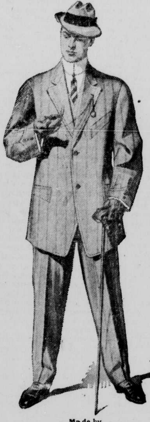
Made by Felix Rothschild & Co., Vo-to-date Clothiers CHICAGO