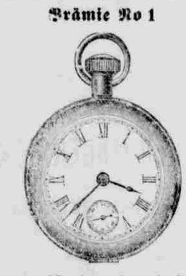
Prämie No 1

Eine dieser schönen Prämien und der Nebraska Staats-Anzeiger auf ein Jahr für $2.00.