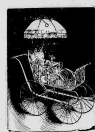
Eine Auswahl von 50 Kinderwagen zu $4.00 bis $30 je.