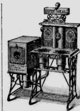
Alleinige Agenten für die berühmten „Laid Real“ Gas- und Gasolin-Decken.