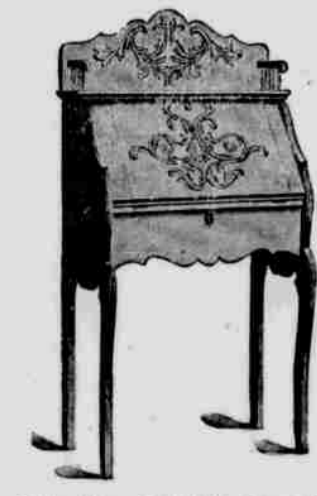
Solide eichene „Desk“ für Damen für $5.50.