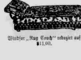
Wunder „Kug Couch“ reduziert auf $11.00.