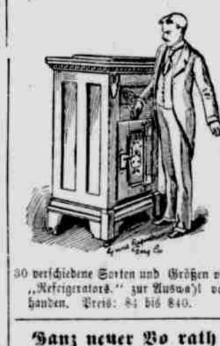
30 verschiedene Sorten und Größen von „Refrigerators“ zur Auswahl vorhanden. Preis: $1 bis $40.