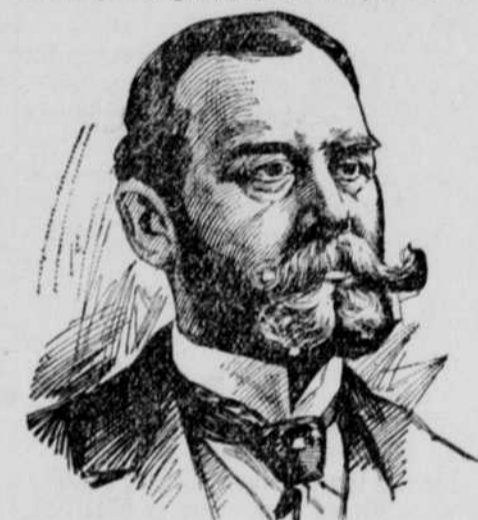
Staatssekretär John Hay.