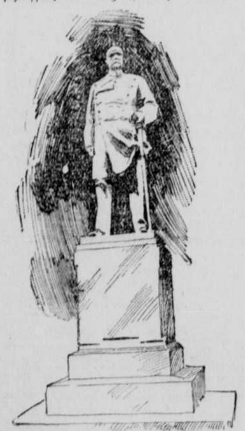
Das Bismarck-Denkmal in Altona.

Neues Bismarck-Monument. Königlich in Schleswig-holsteinischen Marken errichtet.