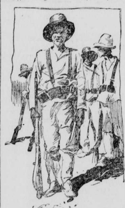
Ein Kubanischer Patriot.