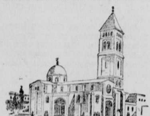
Die Erlöserkirche zu Jerusalem.