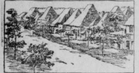
Straße in Manila.