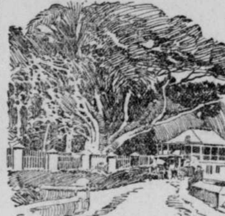
Die Straße von Ponce nach San Juan.