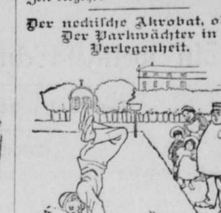
Der neckische Akrobat, oder: Der Parkwächter in Verlegenheit.

„Gehrer (die Frühkaffeeaffe in der Hand): „Ein herrlicher Trank!“