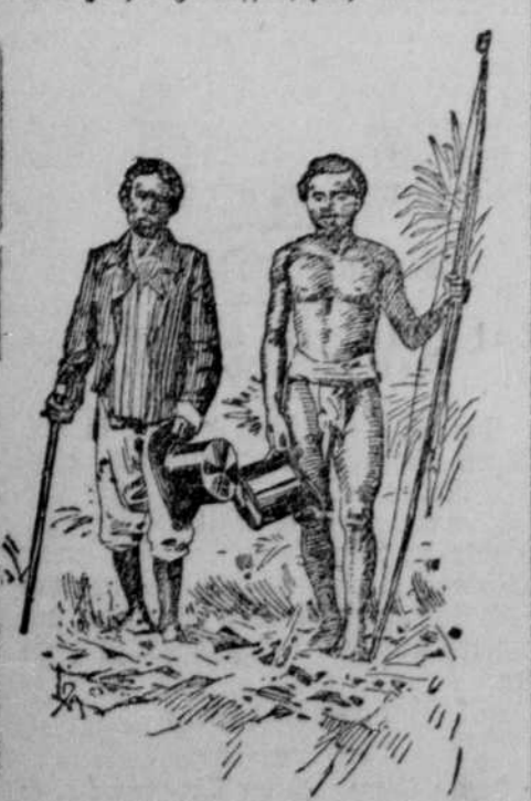
Eingeborene (Tagalen) der Philippinen.

Die Besatzung der Philippinen wird nicht allein mit Gewalt unterdrückt.