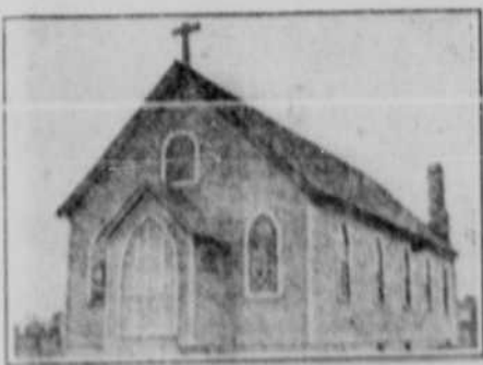
Sankt Anna Kirche von Gull Lake.

Von einem schnellen Kirchenbau wird aus Norfolk im Staate Virginia berichtet. Dort wurde der Plan der römisch-katholischen „Sankt Anna-Kirche von Gull Lake“ binnen einer