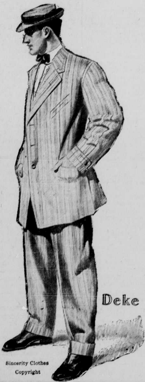
Sincerity Clothes Copyright

Der Golden Rule Kleiderladen wird einen Verkauf von