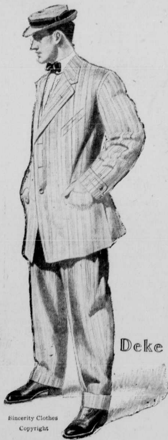
Sincerity Clothes Copyright