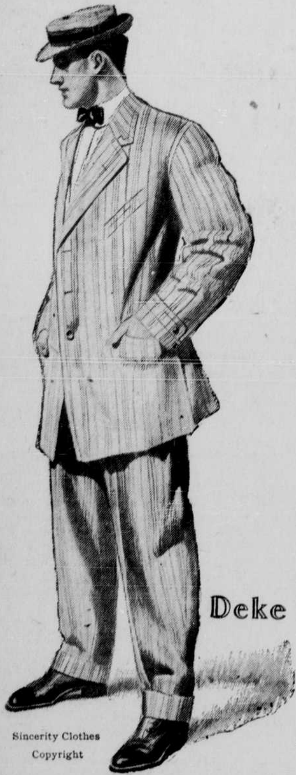
Sincerity Clothes Copyright