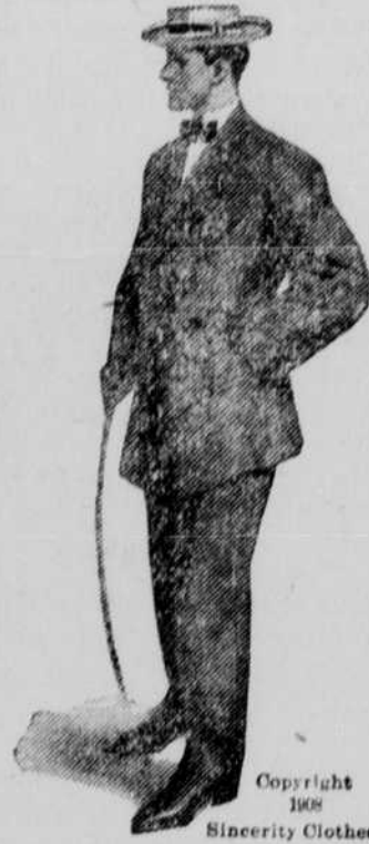
Copyright 1908 Sincerity Clothes

Beobachtet in ere Schaufenster während der nächsten Woche, und Ihr werdet die neuesten Moden und beste Auswahl in der Stadt zu sehen bekommen.