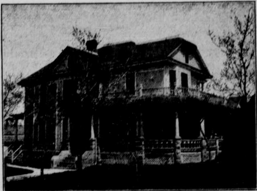
E. F. Filter Residenz, Bloomfield.

Ein gemütliches Gotteshaus scheint die neuerebaute Kirchenkirche in At-