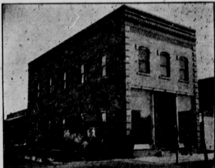
Callins Gebäude, Bloomfield.

Immer mehr häufen sich die Klagen über mangelnde Arbeitskräfte für den landwirtschaftlichen Betrieb, und wo sie zu erlangen sind, muß ein hoher Preis dafür gezahlt werden. So gar in Zeiten des Bürgerkrieges, als Millionen arbeitsfähiger Männer an der Front standen, soll es leichter gewesen sein, Farmarbeiter zu erlangen, als jetzt. Es handelt sich da um eine zeitgemäße Frage, die ein