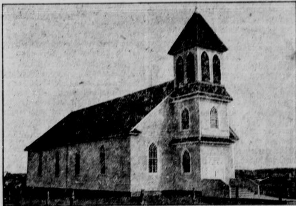
Ev. Luth. Dreifaltigkeits-Kirche, Bloomfield.

In Nebraska stehen 21,064 Personen im Dienste der Eisenbahnen. Davon kommen 3368 auf Zugdienst, 4608 auf Bahnarbeit und 13,088 werden ander-