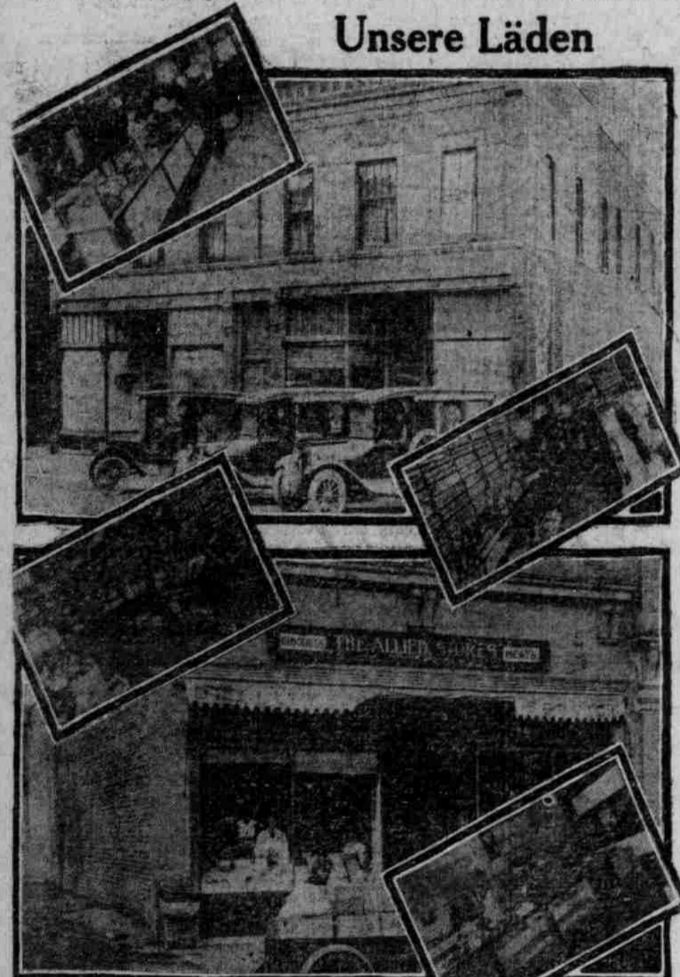
Oberes Bild.—Innen- und Außen-Ansicht des Ladens No. 1, 2223 Leavenworth Straße.