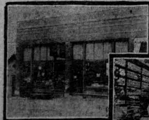
Außen-Ansicht des Ladens No. 3, 22. Straße und Poppleton Avenue.