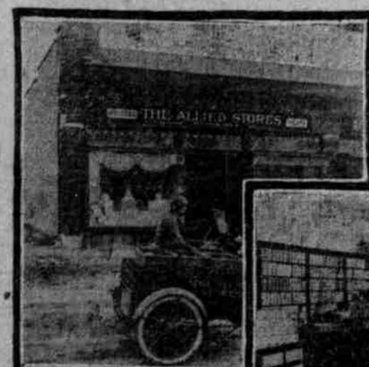
Innen- und Außen-Ansicht des Ladens No. 4, 4965 Dodge Straße.