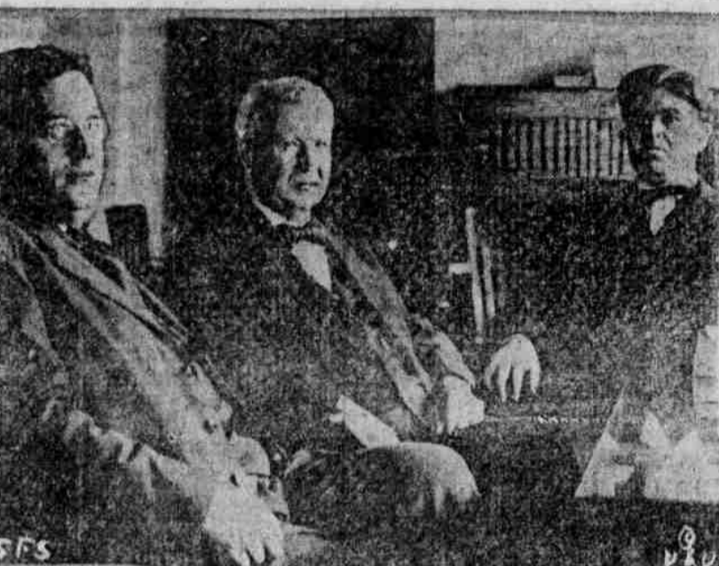
Arbeitssekretär Wilson in Beratung mit den Vertretern der Grubenleute, in der Absicht, den Streik zu verhüten