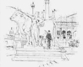
Die Central-Station der Ausstellung.