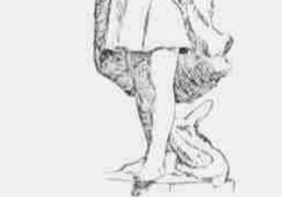
Die Silberne Columbus-Statue.