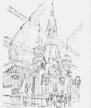
Die dänische Section im Industrie-Palast.