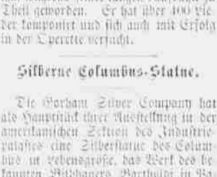
Die Silberne Columbus-Statue.