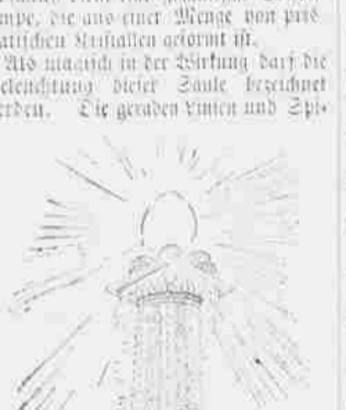
Der elektrische Lichtturm.