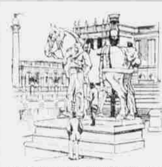
Retenfallsamt und nennwürdigen Werkes.