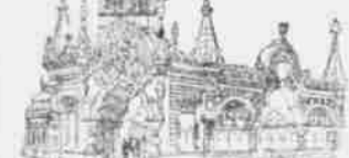
Der russische Pavillon im Hauptausstellung.