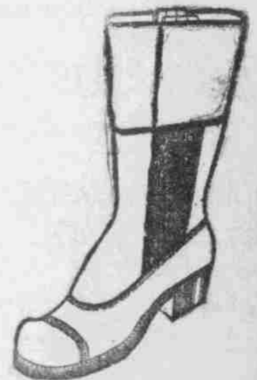
Stiefel, Kalfleder-Stiefeln, Hüftstiefel und andere, billiger.

Broadway und Main Str., Council Bluffs, Iowa