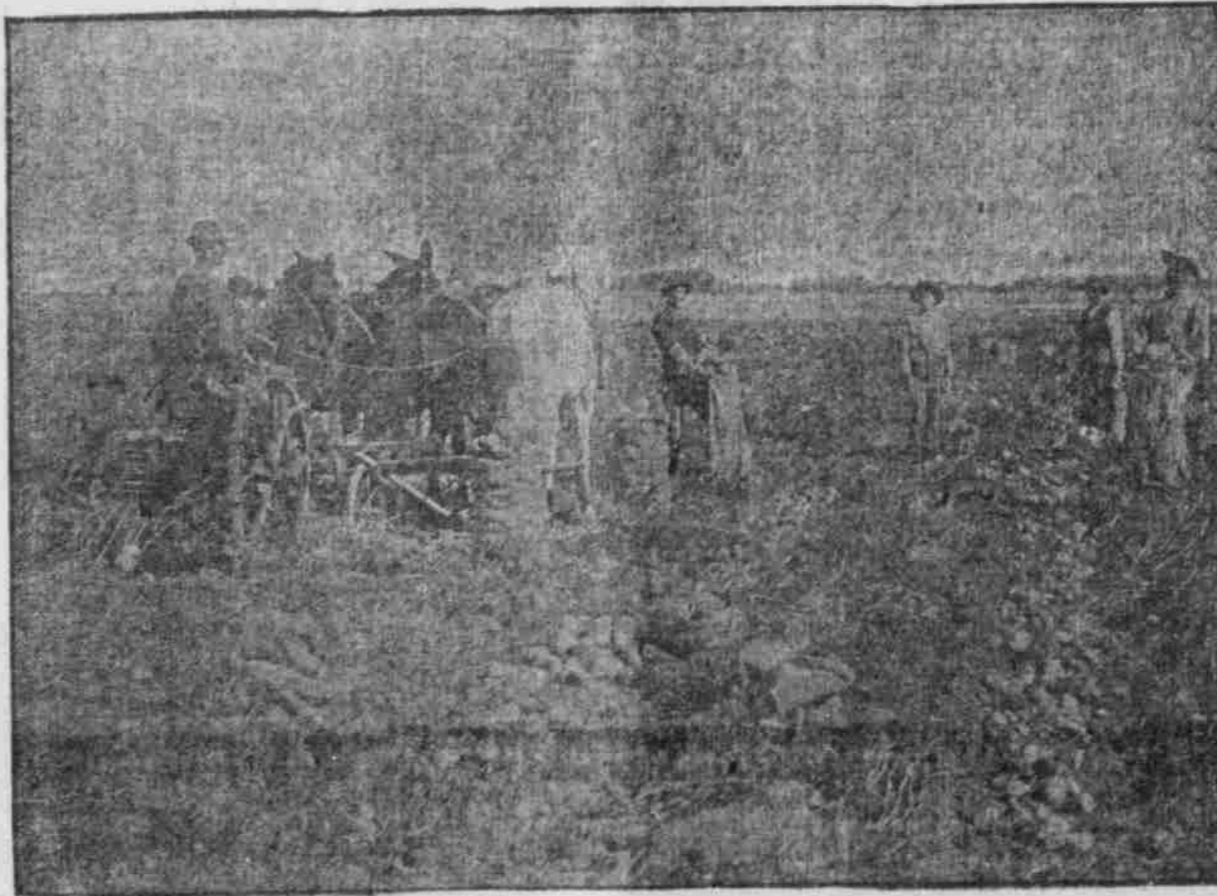
„Kartoffel! Na, ich sollte sagen...“ (Zuvorkommenheit des „Sospodar“.)

Zuckerrüben, bringen von 20 bis 25 Ton- nen per Acker.