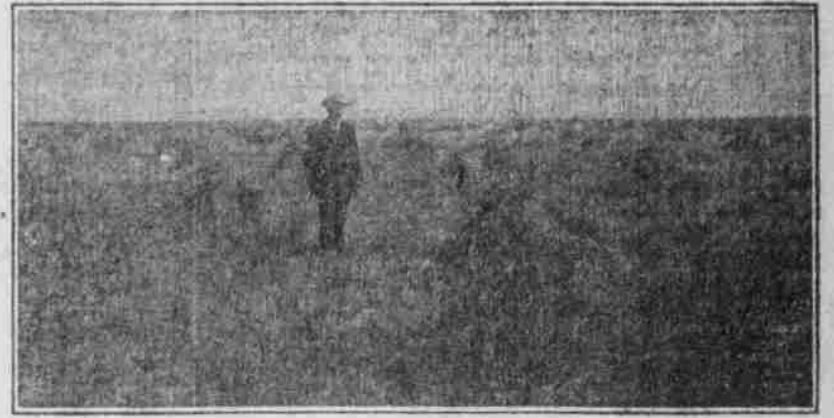
Großes Weizenfeld nahe Alliance.