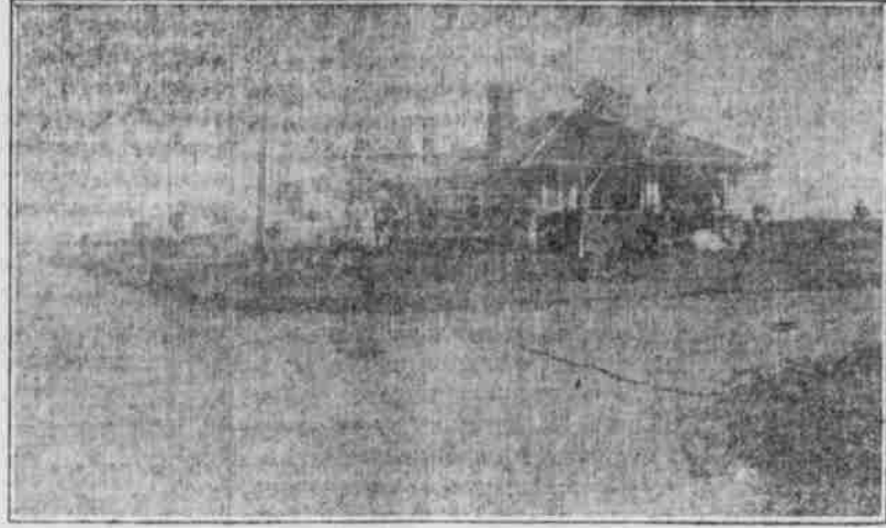
Ein kostiges Heim in Alliance.