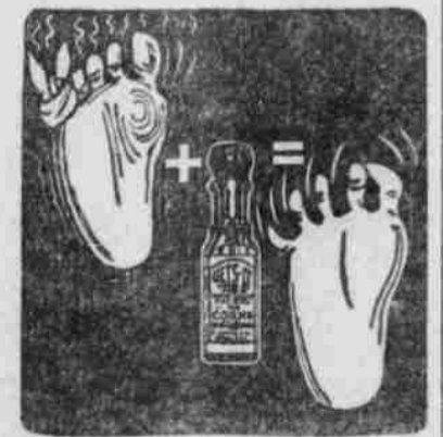
Ein Hühnerauge plus „Gels-31“ ist gleich einem Fuß ohne Hühneraugen.

Ihre Schühneraugenentzündungen beseitigen und weil sie auch helfen, den harten und schmerzhaften Hornschichten abzutragen.