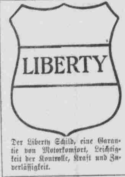
Der Liberty Schild, eine Garantie von Motorform, Leichtigkeit der Kontrolle, Kraft und Zuverlässigkeit.