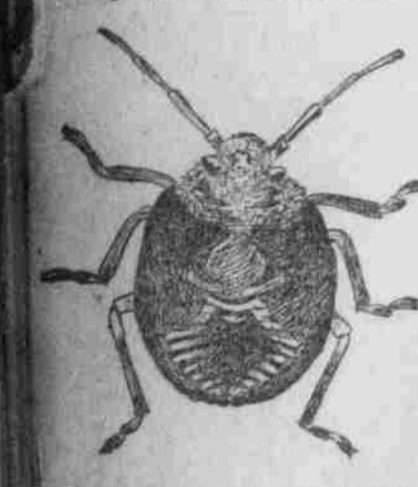
Wann man die Käfer abnimmt, bis man Mitte Juli fast gar keine mehr antrifft. Die Entwicklung der jungen Brut dauert bis in die letzte Woche des August oder Anfang September hinein.