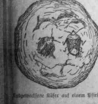
Wann man die Käfer abnimmt, bis man Mitte Juli fast gar keine mehr antrifft. Die Entwicklung der jungen Brut dauert bis in die letzte Woche des August oder Anfang September hinein.