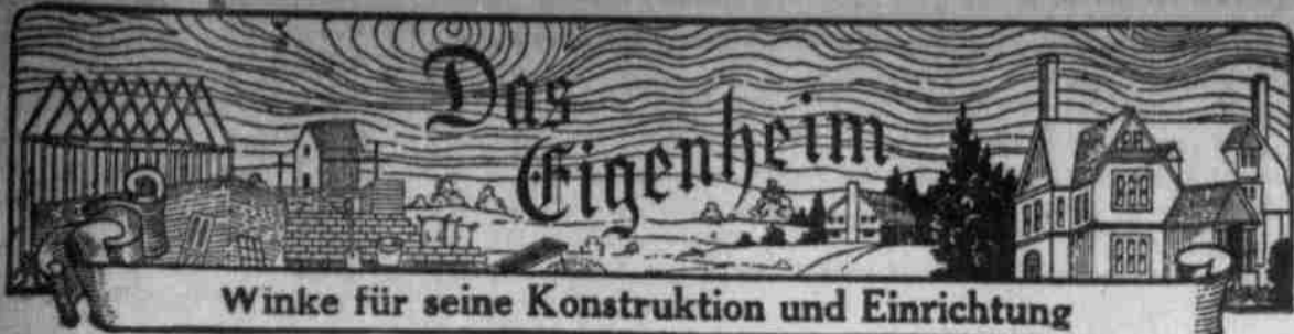
Winke für seine Konstruktion und Einrichtung