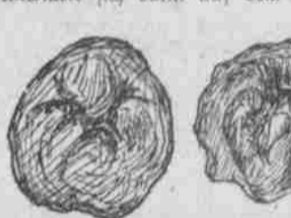
Durch den Curculio-Käfer verursachte Verunreinigungen junger Äpfel.