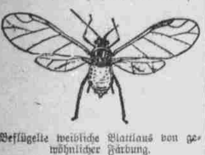
Die Befämpfung der Läuse durch Räucherung geschieht gewöhnlich mit Schwefelkohlenstoff...