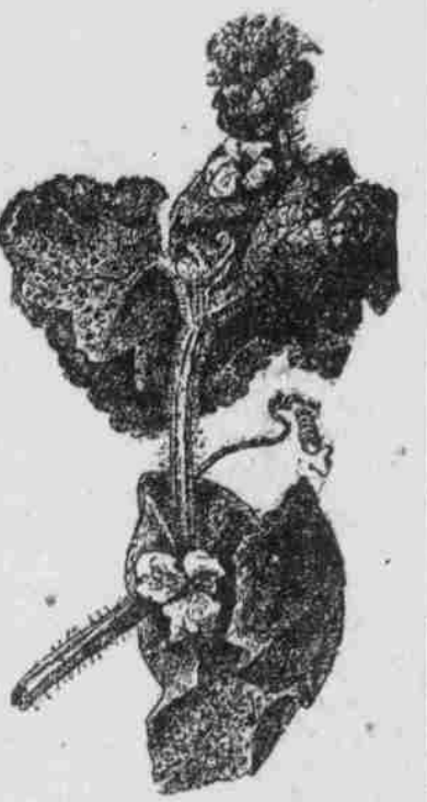
Melonenblätter, auf der unteren Seite mit Läusehaufen besetzt, manche zusammengedrückt.