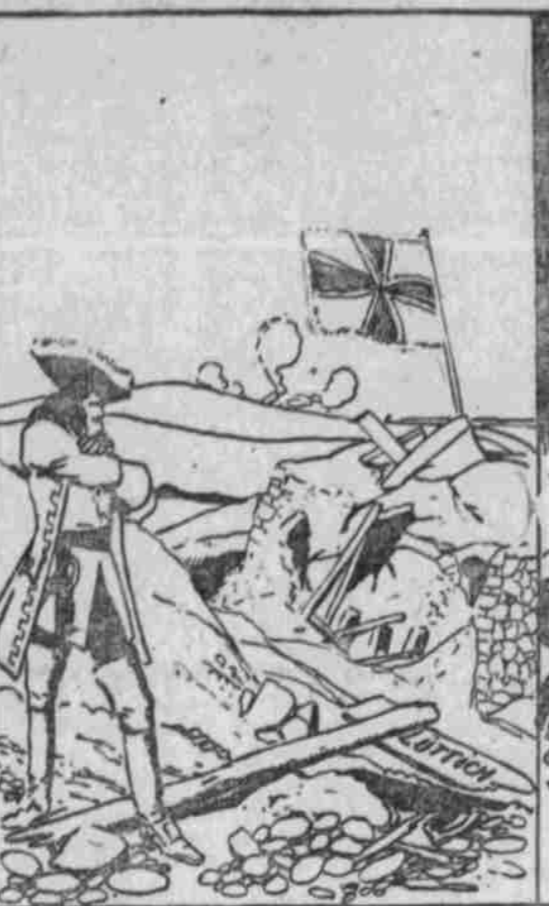
zogen uns aus strategischen Gründen ein wenig zurück, aber die Forts von Lüttich halten sich noch.“