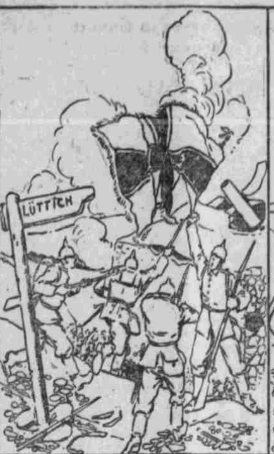
„Wir ließen den Feind an unsere Forts herankommen und —“