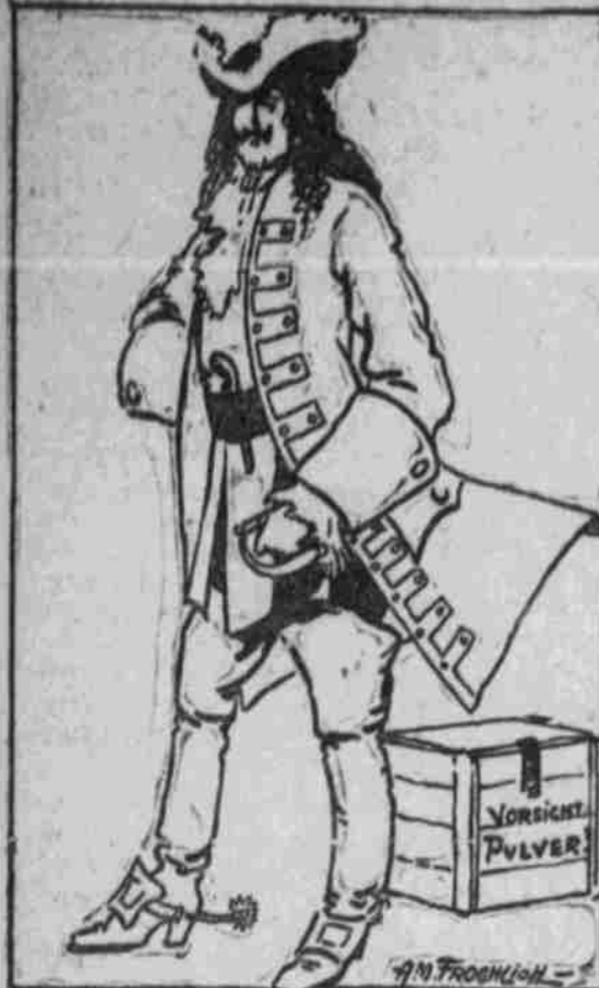
Baron Münchhausen, Kriegsbericht-erzähler der Allierten Presse.

„Die Forts von Lüttich halten sich noch immer!“