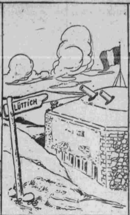
„Wir erwarteten Kegelbewußt die Ankunft der deutschen Barbaren vor Lüttich.“