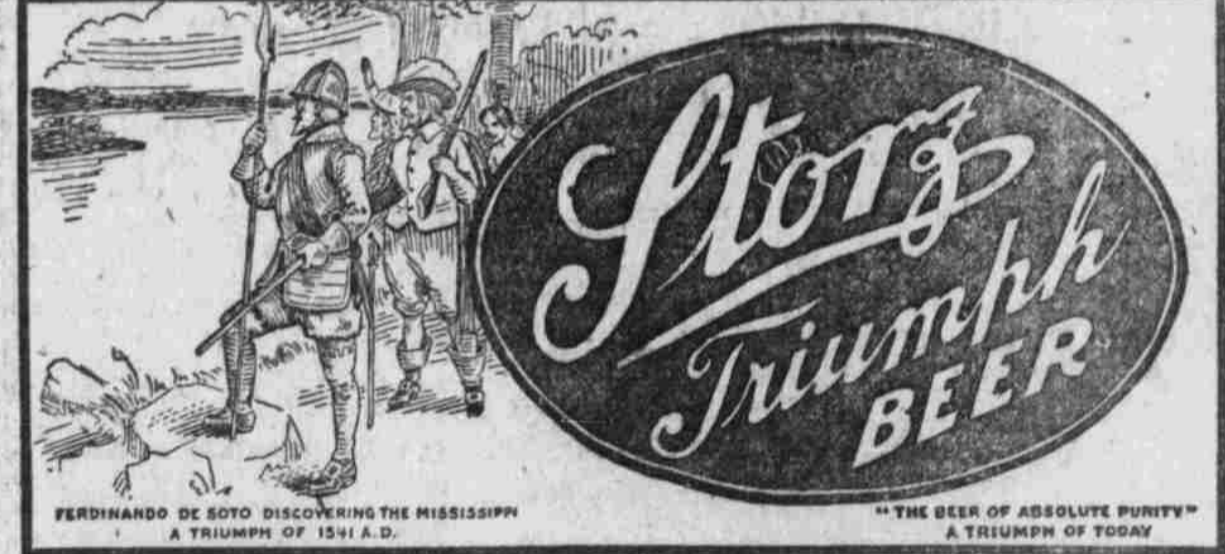
Ferdinando de Soto discovering the Mississippi - A triumph of 1541 A.D. - THE BEER OF ABSOLUTE PURITY - A TRIUMPH OF TODAY

Feeders $4.75—5.00. Mutterfische $5.85—5.75. Feeders $4.00—4.35.