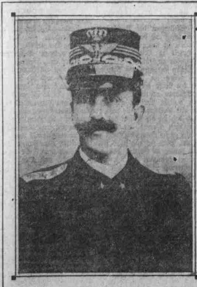
KÖNIG VICTOR EMANUEL VON ITALIEN