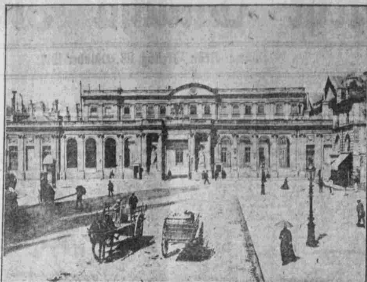
Das Hotel de Ville in Bordeaux, der derzeitige Sitz der französischen Regierung.