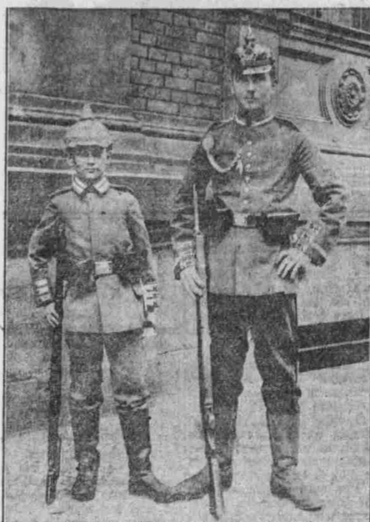
Der kleinste und jüngste Gardist.