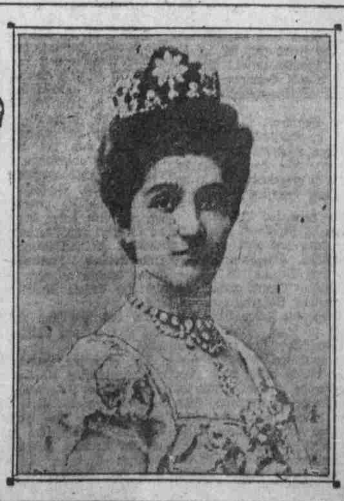
KÖNIGIN VON ITALIEN