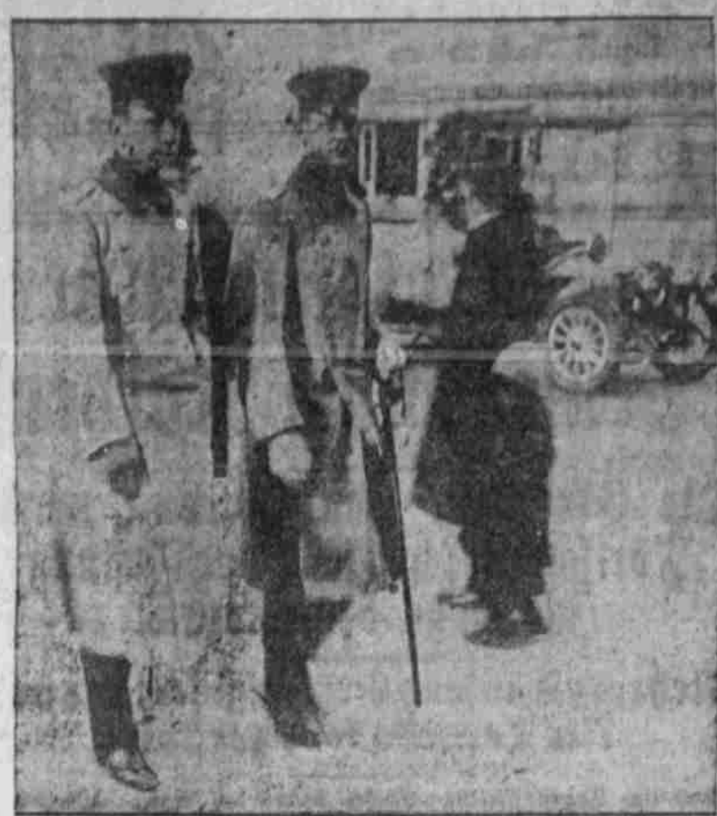
Prinz Joachim von Preußen.