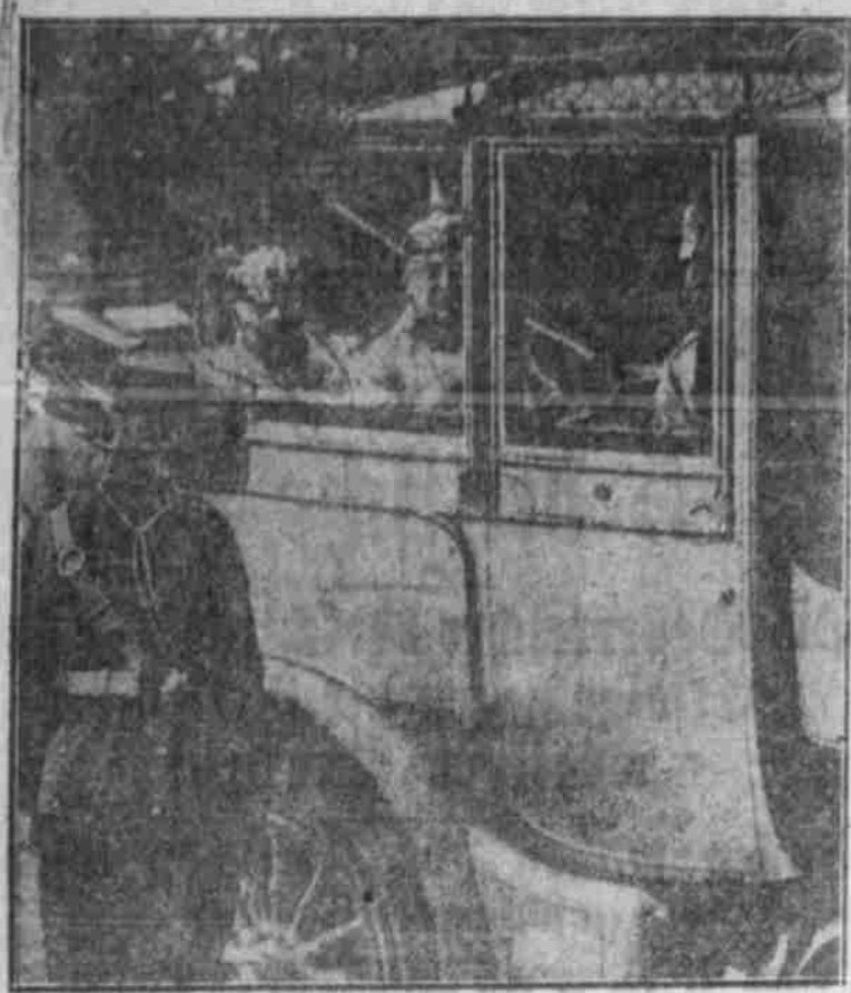
Der deutsche Kaiser an der Front.