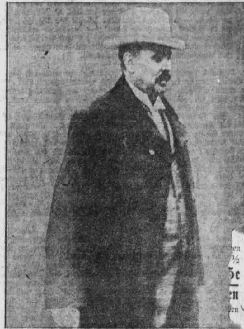
General Botha, Premier von Süd-Afrika, der früherer Deutschenfreund.