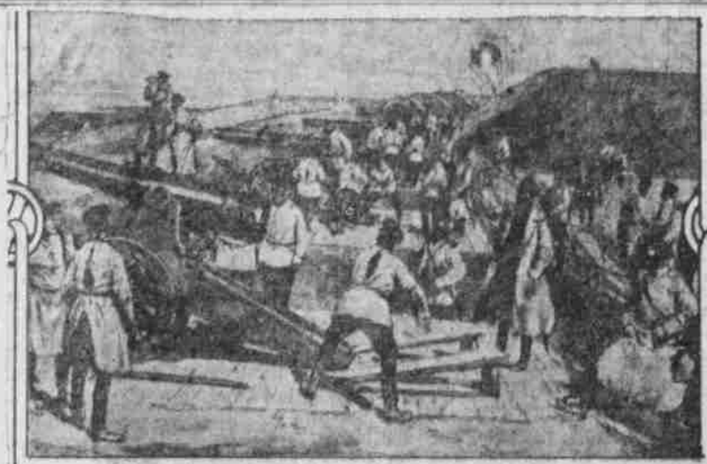
RUSSISCHE ARTILLERIE in einem FORT - FAHRBARE PANZERLAFETTE für 53cm-SCHNELLFEUERKANONE 144