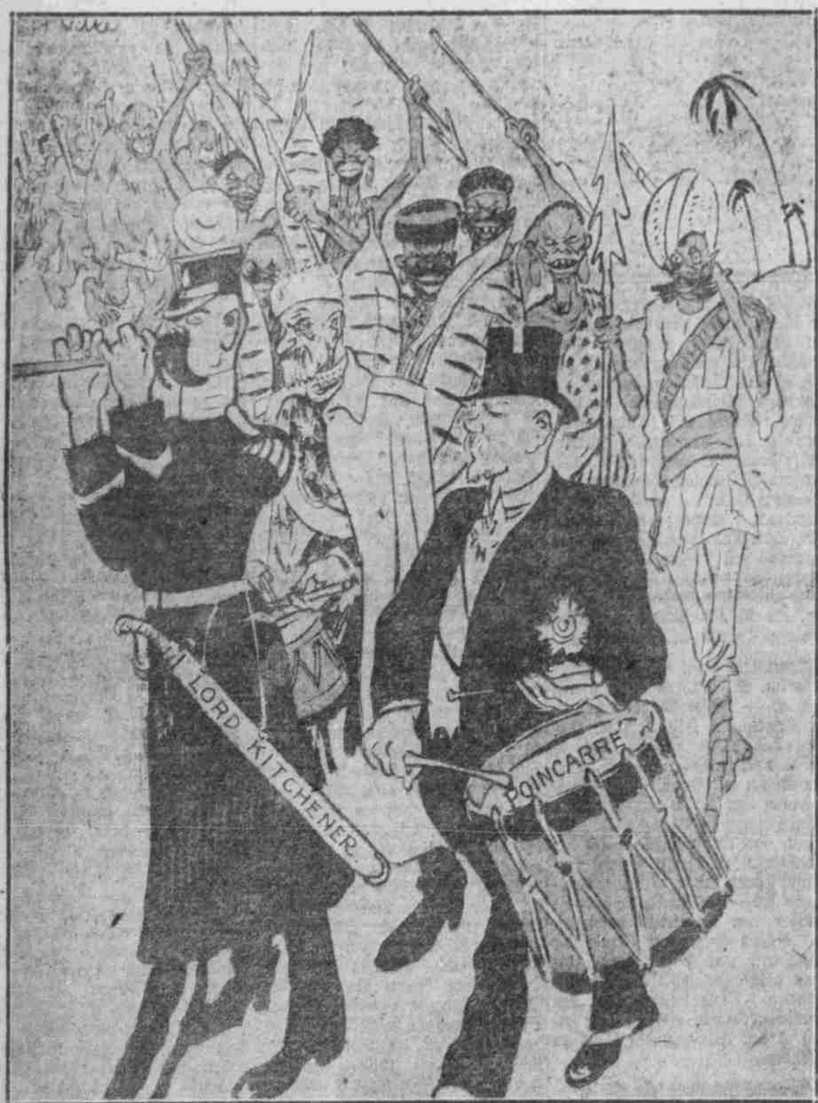
Das letzte Kultur-Aufgebot.