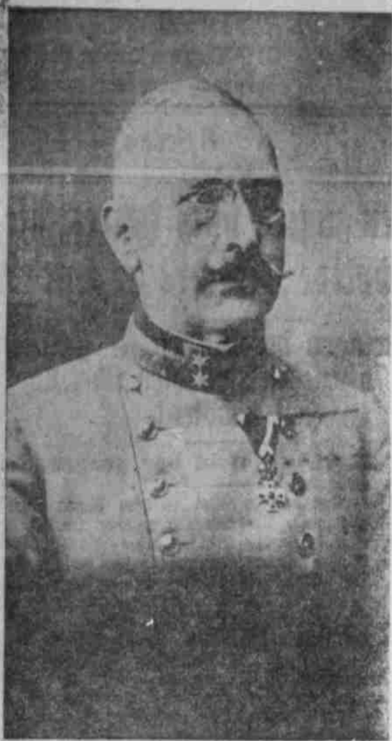
General Viktor Dankl.