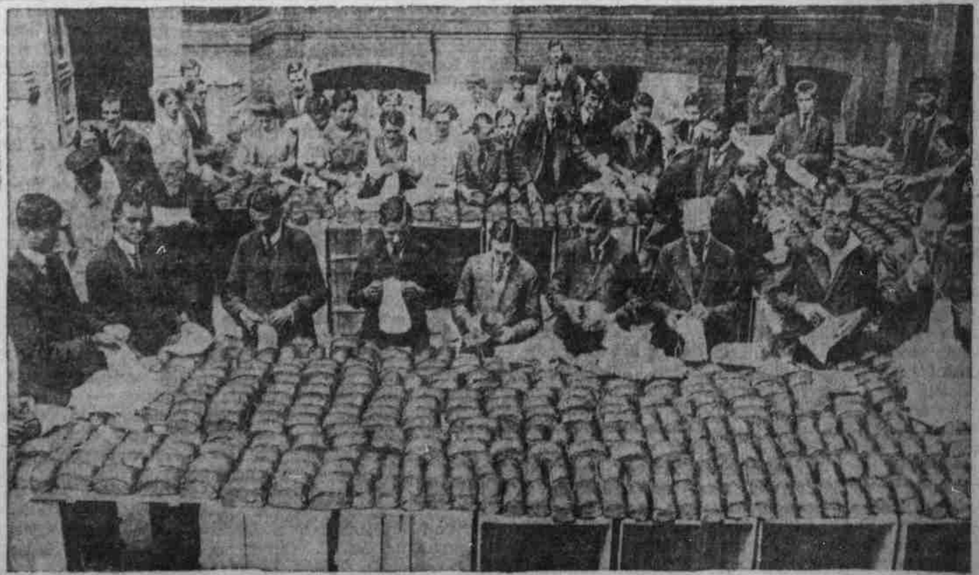
Verpackung des Brotes für die deutsche Marine.