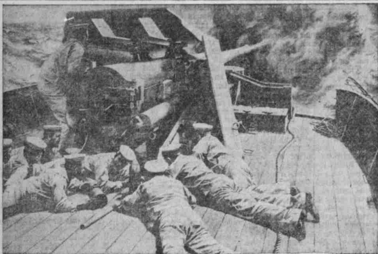
Eine Batterie des brit. Hilfskreuzers „Highflyer“.