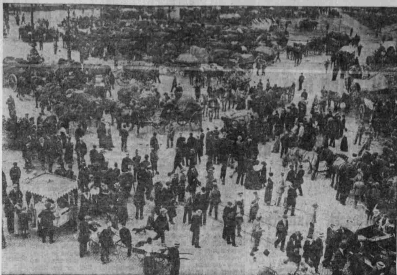
Die deutsche Proviantkolonne in Brüssel.