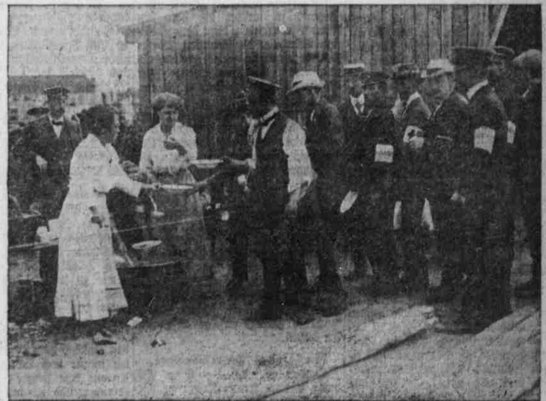
Die Deutsch-Wehr beim Mittagessen.