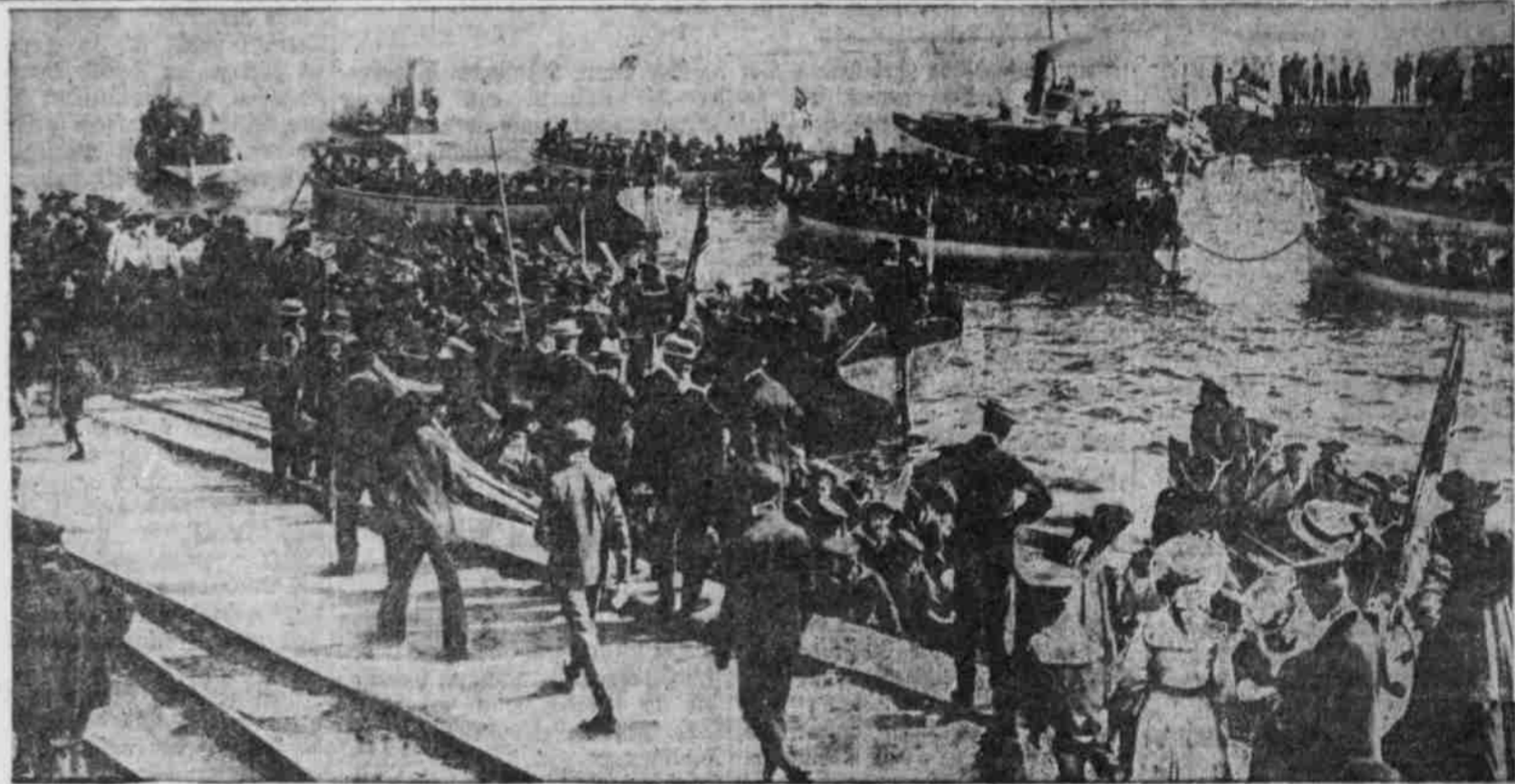
Marine-Reservisten schiffen sich in Kiel ein.