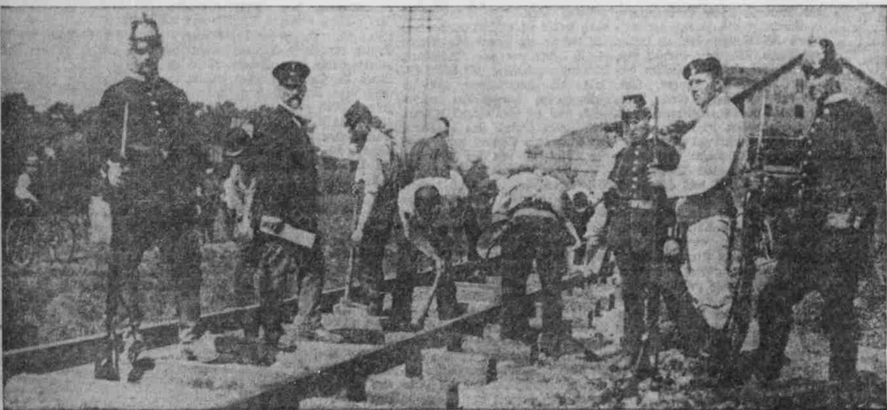
Französische Gefangene beim Bahnbau in Bayern.