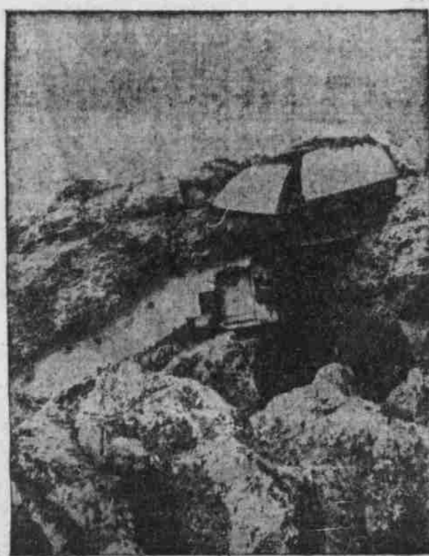
Wirkung des 42 cm. Geschosses in Tüchtig.

Wenn man bedenkt, daß die Dienste der Nebraska Territorial Miliz ohne die geringste Vergütung von Seiten der Bundesregierung oder der Nebraska Gesetzgebung geliefert, und daß die Gefahren, welche die damit verbundenen Entbehrungen ohne Murren so groß waren, als in den wichtigsten Expeditionen während des Rebellionskrieges, so wird man ihre Opferwilligkeit kaum gebührend würdigen; sie waren Soldaten ohne Sold und ohne Aussicht auf Pension; sie waren von den edelsten Motiven geleitet, die Heimath ihrer Freunde zu schützen, sowie den Einwanderern aus den südlichen Staaten und Europa für alle Zeiten den Beweis zu liefern, daß ihre Niederlassung unter uns willkommen ist und ihr Eigenthum sowie ihre persönliche Freiheit und Sicherheit trotz aller drohenden Gefahren unerschrockene Verteidiger in