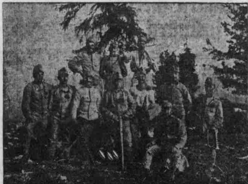
Oesterr. Arbeits-Detachement in Tyrol.