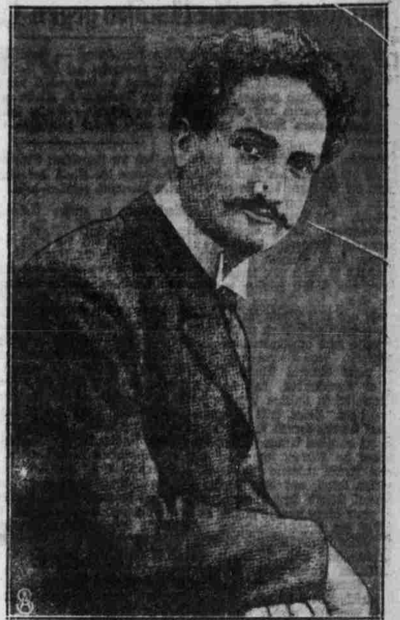
Dr. Ludwig Frank, der bekannte sozialdemokratische Führer, der vor Luxemburg gefallen ist.