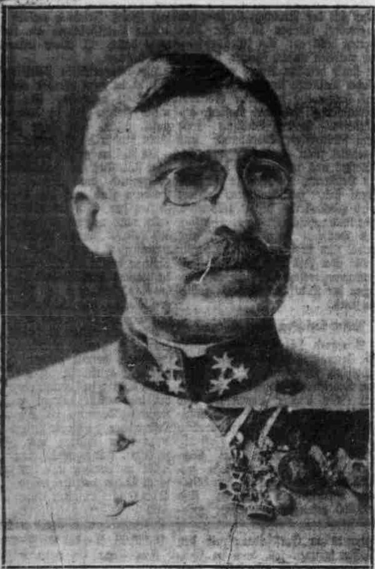
General Moritz Ritter von Auffenberg, Oberbefehlshaber der in Rußisch-Polen operierenden österreichisch-ungarischen Armee.