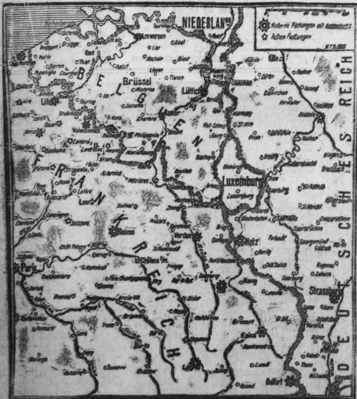
Karte vom westlichen Kriegsschauplatz.

Eine Fabel. „Wie höflich bist du doch“, sagte die Taube zur Krähe. Dein Gefieder ist glanzlos und unschön; deine Stimme ist mißklingend. Die Menschen mögen dich nicht, mich aber lieben sie!“ „Oh — sie lieben dich“, entgegnete die Krähe, „und fressen dich auf!“