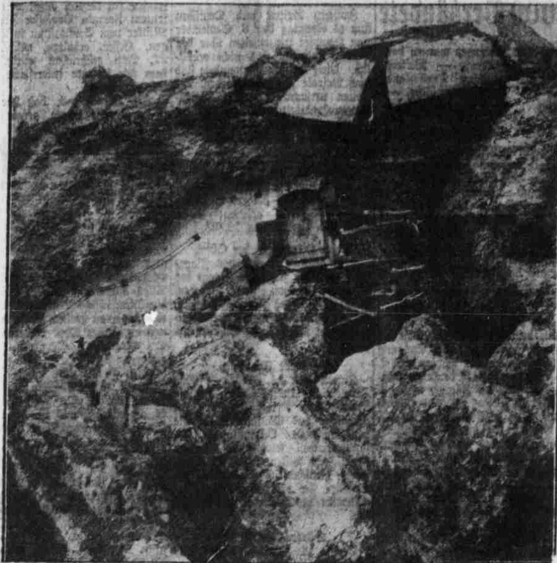
Die verheerende Wirkung eines einzigen deutschen 42cm-Geschosses auf das Kaiserfort Louvin der Festung Lüttich. Dieses Bild giebt eine passende Darstellung der furchtbaren Wirkung des deutschen 42 cm-Belagerungsgeschüßes, dessen Einzelschuß die härtesten Betons- und Kongerbetons durchdringt.