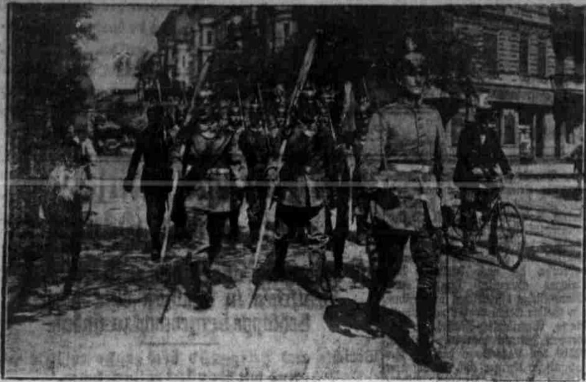
Die deutschen Feldzeichen zur Gruppe gebracht. General von Emmich, der Eroberer von Lüttich.