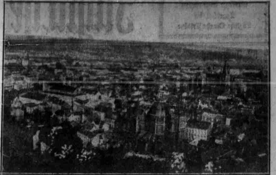
Ansicht der Stadt Lüttich.