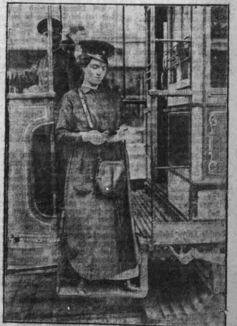
Frauen fungieren in Berlin als Kondukteure auf den Straßenbahnwagen.

Und schlägt die Thurmuhre neune Maß man zu Hause sein, Gehst über Stock und Steine Zum großen Thor hinein. Dann muß man mit Entzünden Des harten Strohsack drücken, O welche Lust, o welche Freud O welche Lust, Soldat zu sein.