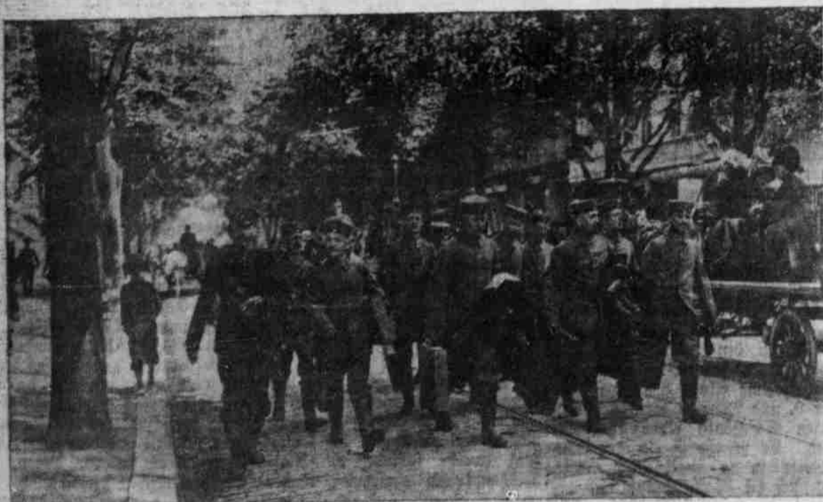
Reservisten in der neuen Felduniform.