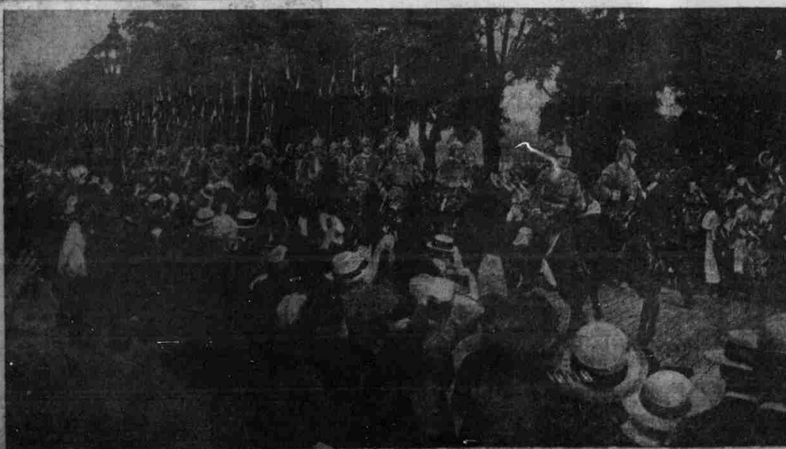
Berlin's Lieblinge. — Die Garderückfriere rücken in's Feld.