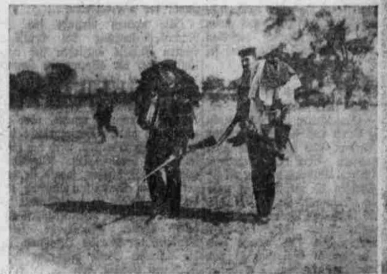
Empfang der Kriegsausrüstung.