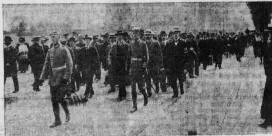
Reservisten in Berlin auf dem Marsch zur Kaserne.