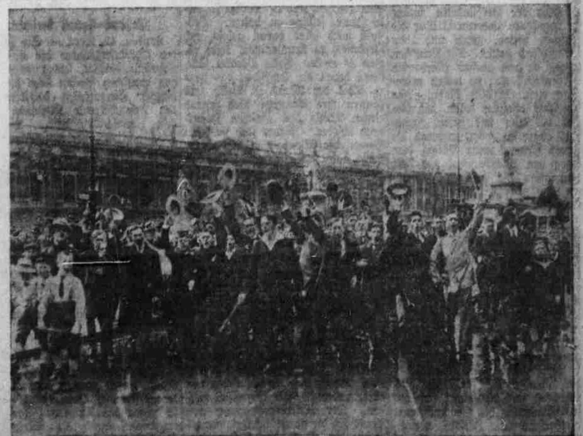
Eintreffen der Siegesnachricht von Lüttich in Berlin.