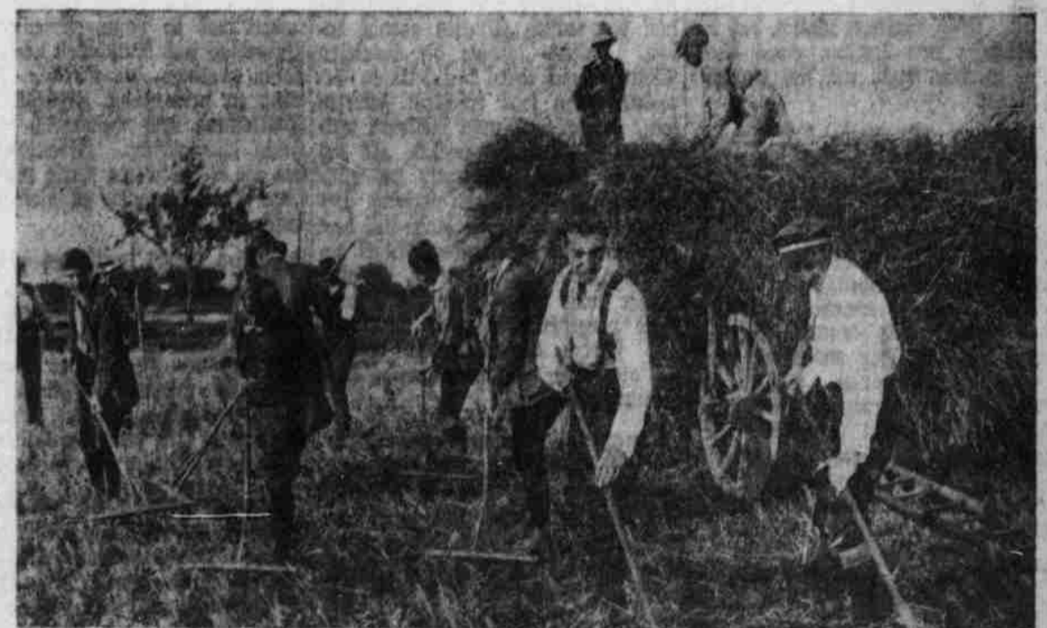
Gymnastiken bei der Ernte-Arbeit.