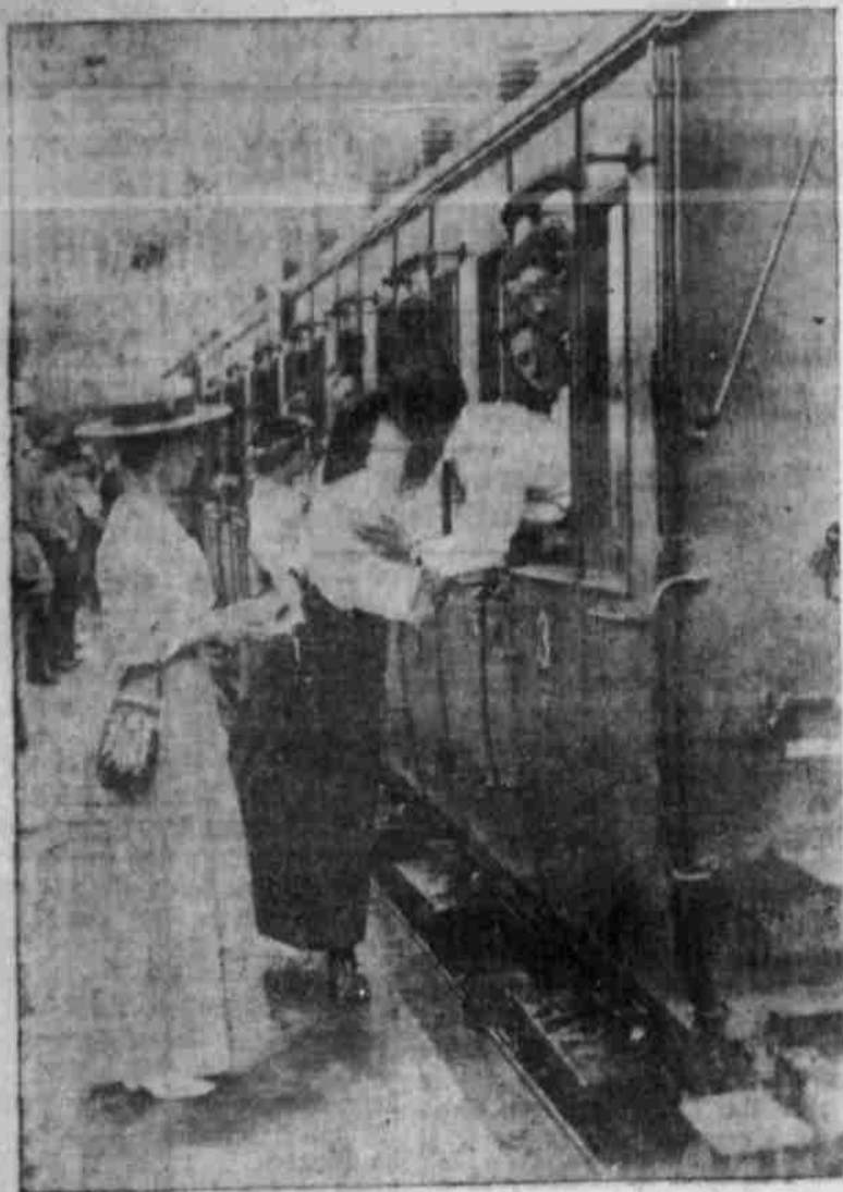
Der Abschied vom Liebsten.