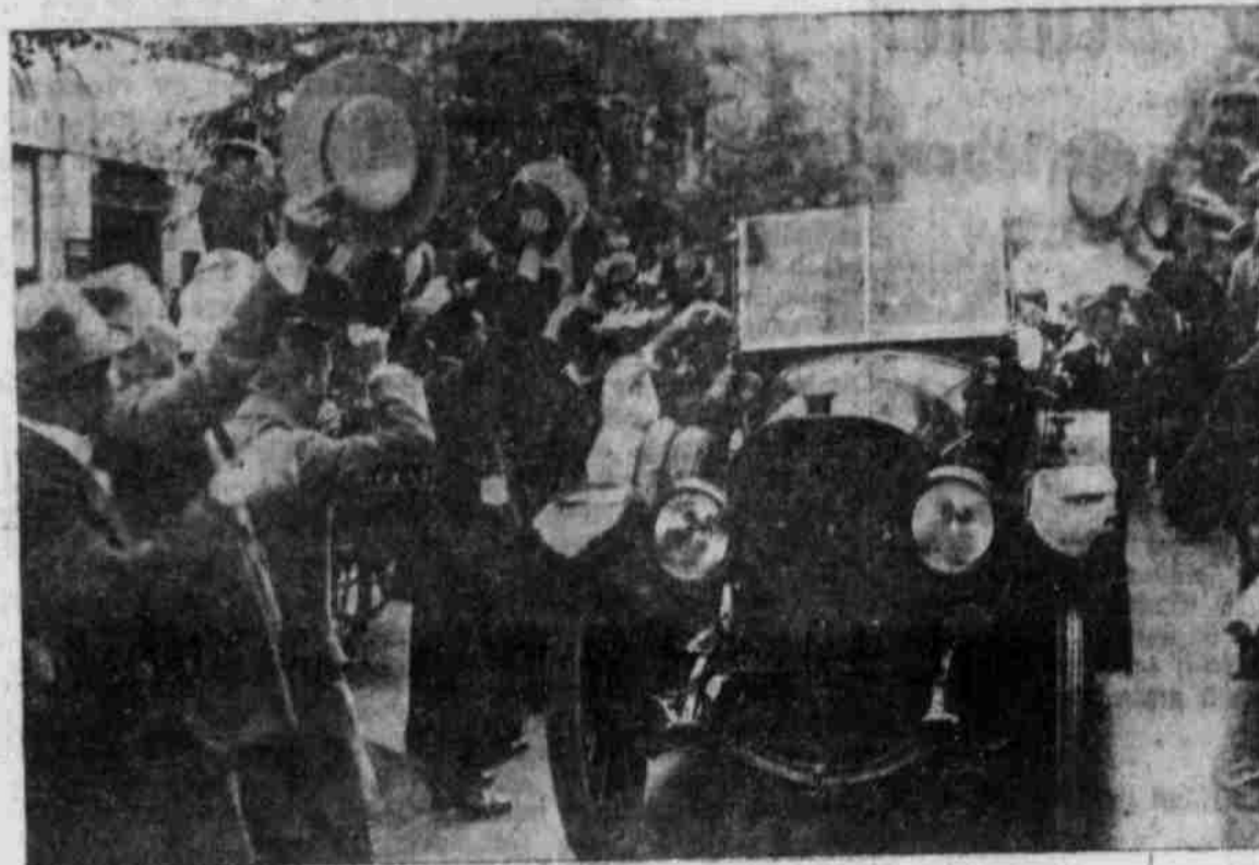
Der Kaiser wird nach der Kriegserklärung stürmisch begrüßt.