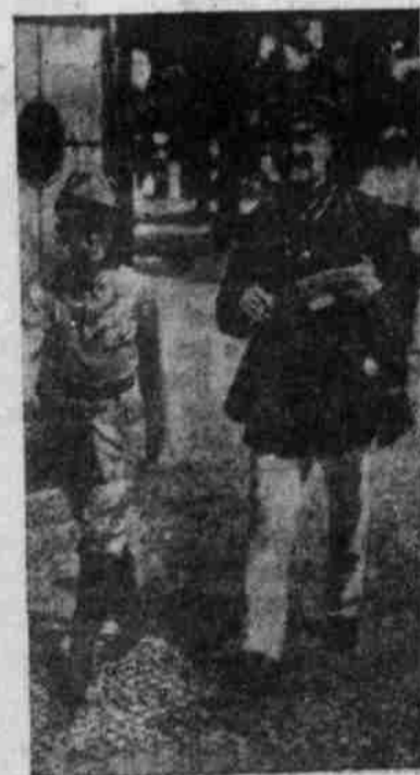
Postbote als Postbotenbesitzer.