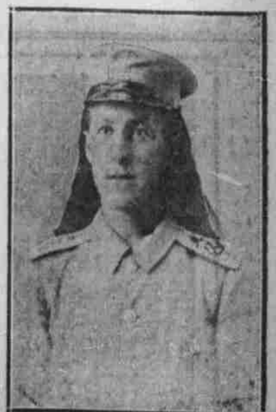
Deutscher Soldat in Tropenuniform.