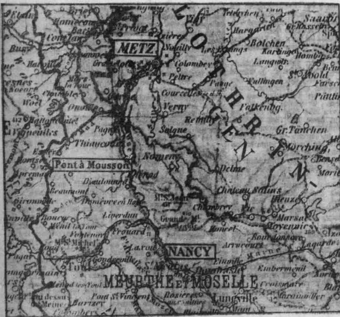
Der Siamarsch der deutschen Rhein-Armee in Frankreich.