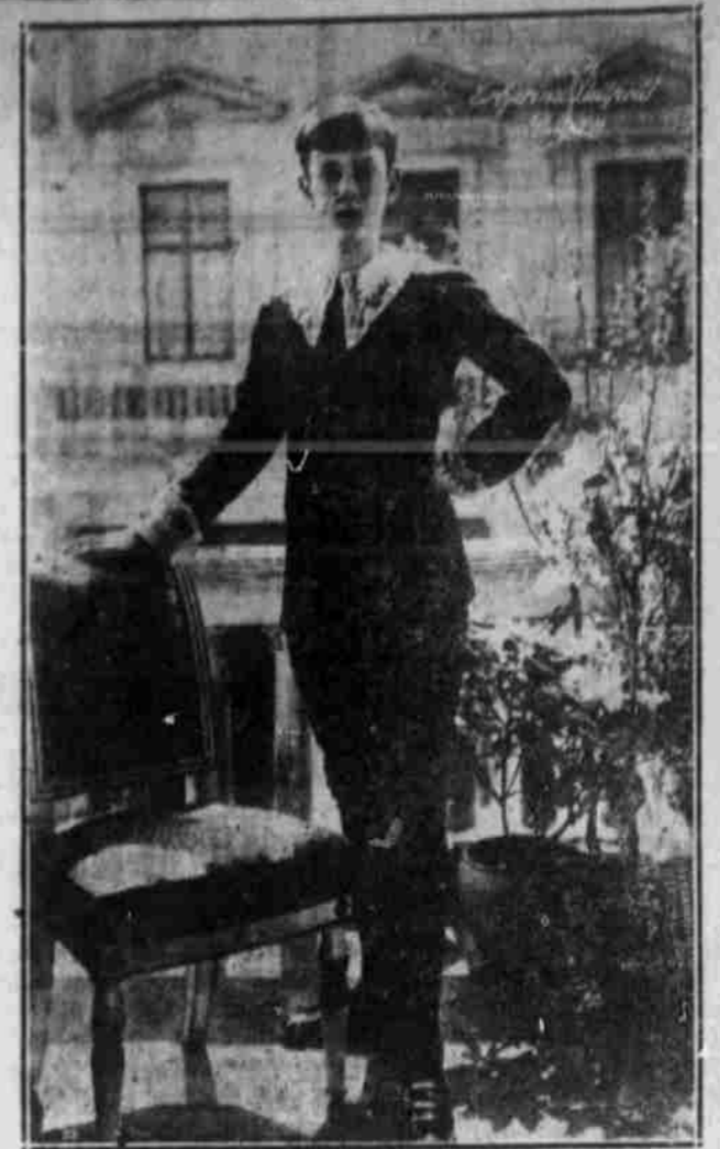
† Prinz Luitpold von Bayern.

Und wenn der böse Sturm mich einst umsaufet, Die Nacht einbrunnet in des Wlthes Gluth; Daß doch schon ärg' in der Welt g'braufet, Und was nicht bebte, war der Preuße Muth. Mag Feind und Fische splittern, ich werde nicht erzittern; Es hüem' und truch, es blühe wild dorein! Ich bin ein Preuße, will ein Preuße sein! ;: