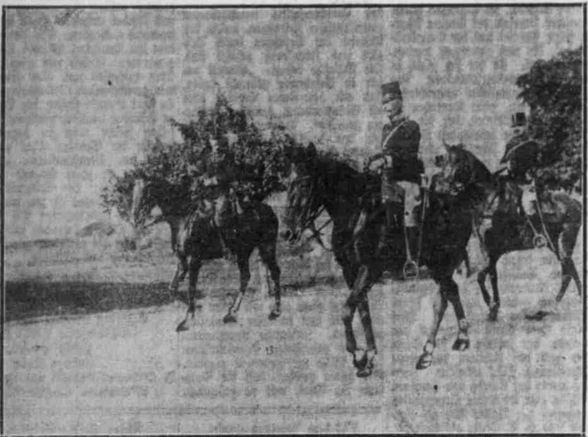
Eine österröichische Offiziers-Patrouille.

Wo Lieb und Treu sich so dem König weihen, Wo Fürst und Volk sich reihen so die Hand: Da muß des Volkes wahres Glück geschehen, Da blüht und wächst das schöne Vaterland. So schwören wir auf's neue dem König Lieb und Treu. ;: Heil sei der Bund! Ja! schlaget muthig ein! Wir sind ja Preußen, laßt uns Preußen sein! ;: