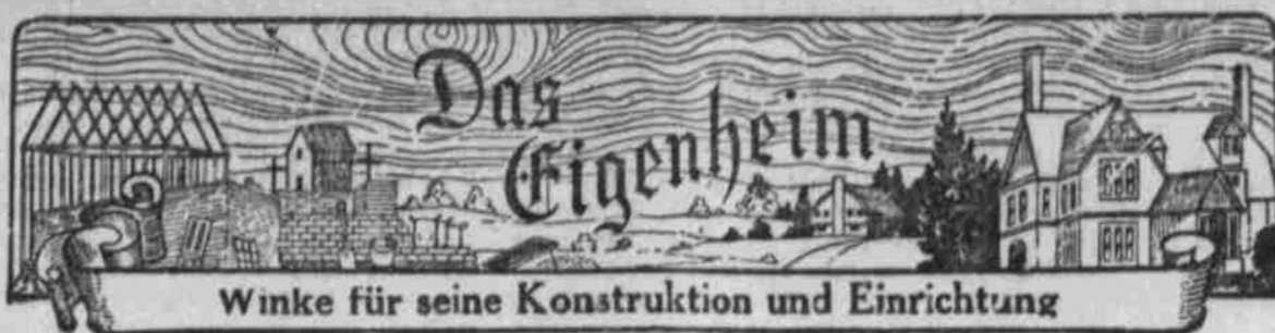
Winke für seine Konstruktion und Einrichtung

OMAHA & COUNCIL BLUFFS STREET RAILWAY COMPANY