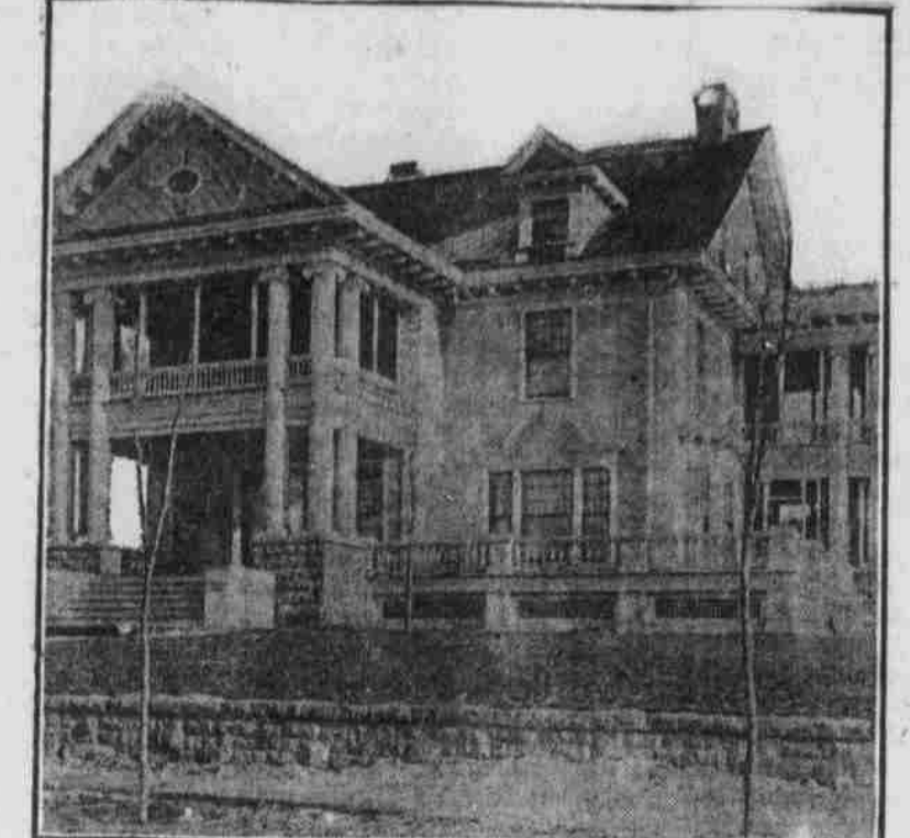
Perspektivansicht nach einer Photographie.