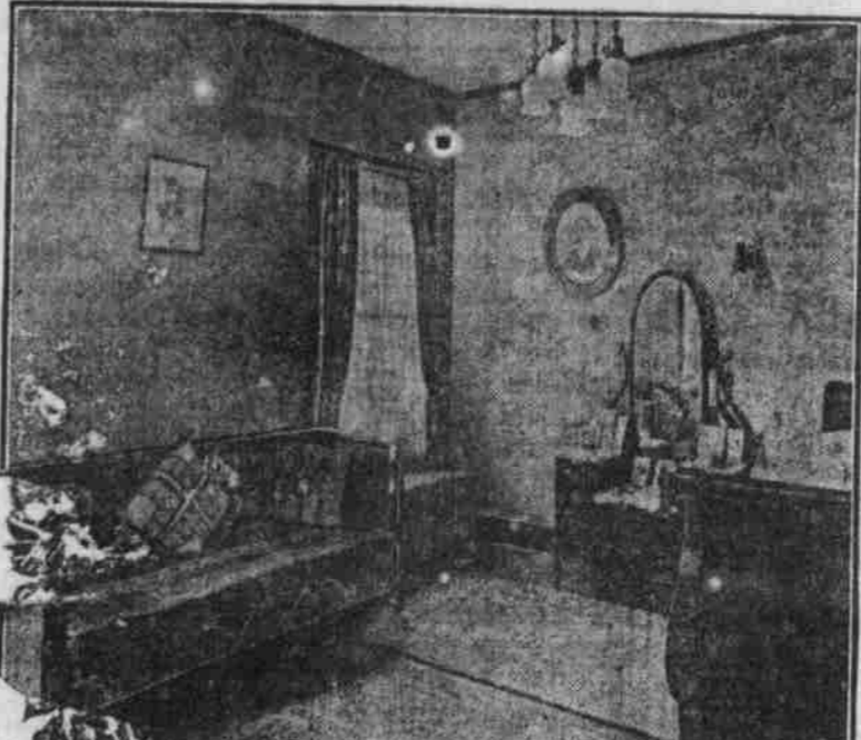
Innen-Ansicht — Schlafzimmer.

Diese Kammer ist bequem eingerichtet, besonders bezüglich der Beleuchtung und der Anbringung der Radiatoren an der Fensterseite. Die Wandbänke, Kleiderhaken und Hängelampe sind aus Birke, mit Mahagonieeinlage; der Fußboden ist aus Birke. Größe 26 bei 30 Fuß. Baukosten, außer Heizung und Wasseranlage, $3500.