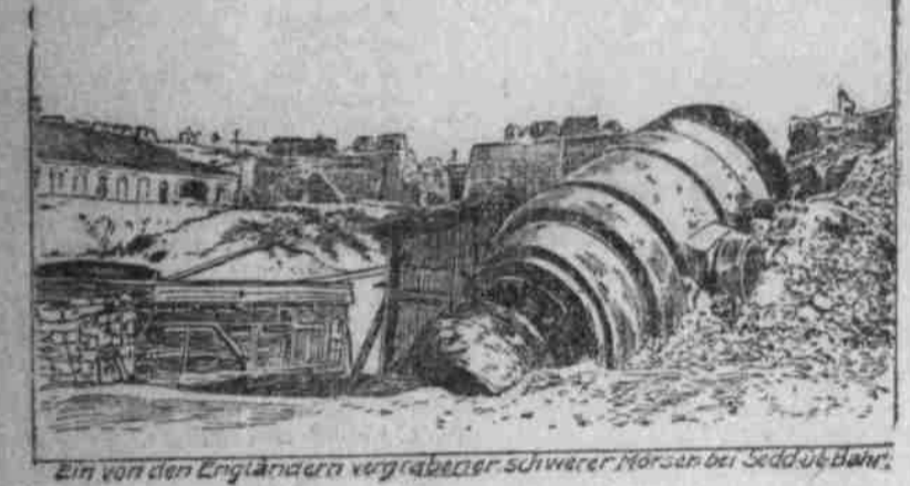
Ein von den Engländern vergrabenem schwarzen Marsch bei Sedd-ud-Dahr.

her denn unser Königspiel den Koran erlaubt ist, zum Teil, damit der Oberst den Sold für sich erspare. Man schätze ein Viertel bis ein Drittel der Truppen abwesend auf Urlaub. Öfters von der einheimischen Armee ist die Koratendivision, deren Stützpunkt Leheran bildet.