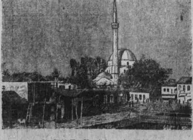
Die Stadt Monastir mit der großen Moschee.

Selbst diese geringe Stärke, nicht viel über 30,000 Mann zusammen, wurde jedoch niemals erreicht, da