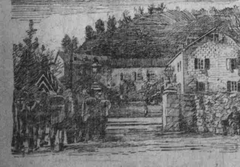
Nizim, Sommerresidenz des Königs Nizim.

Gegen Abend geht ich langsam dem gepflasterten Weg zum Kosaja hinan,