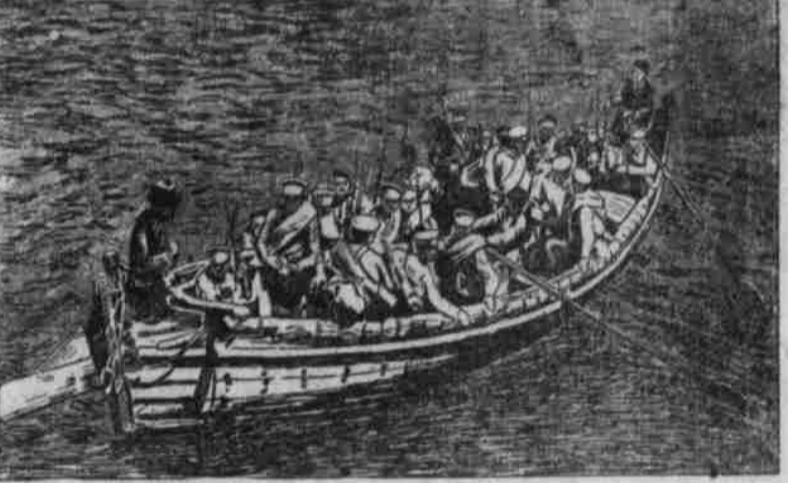
Landung russischer Truppen in Persien.

Die Verwaltung geht im allgemeinen durch Statthalter vor sich, die von der Hauptstadt gestellt werden. Häufig sind es Prinzen von Geburt. Aber es wird gewohnheitsmäßig immer dem Thronfolger zugewandt. Die Statthalter wahlen und wählen so ziemlich nach Willkür, theoretisch sind sie an den Koran und die mündlich überlieferten Befehle gebunden. Jene, die ausgebildet scheinen das Landrecht, namentlich in Hinsicht auf Nachverträge, zu sein. Einer weitgehenden Freiheit erfreuen sich die Komadenstämme, die von Hauptlingen regiert werden. Bei den Kurden und Belutschen gibt es, wie bei den Südalbanen, einen einflussreichen, grundbesitzenden Adel. Die Stämme haben in ihrer Gesamtheit einen Tribut zu zahlen. Dort wird er meist ebenso