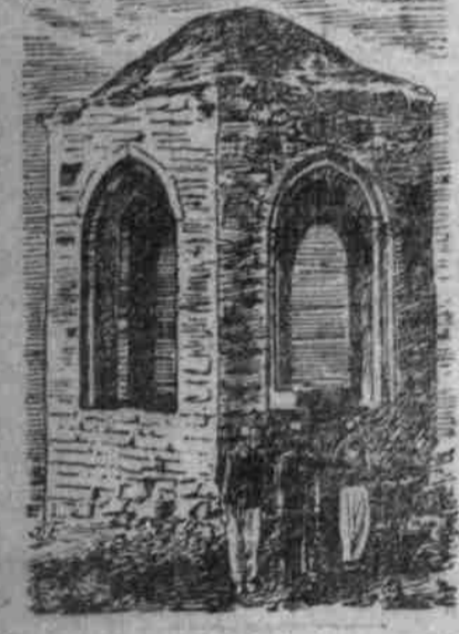
Altes mohammedanisches Grab in Koscov.

Seine Zukunftspläne glißen in ihm, ein wertes Chaos. Aber aus seinen Augen leuchtet die Kraft, sie zu ordnen und sich Leben und Glück