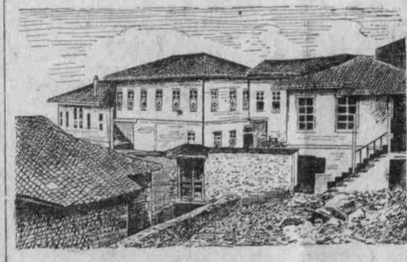
Die „Burg“ von Effah Pascha in Durazzo, Albanien.

Amerikas enorme „Kriegsindustrie“ hat sie sehr vergrößert. Zu den vielerlei Krankheiten, welche bei der Ausübung gewisser — Arbeitsberufe entstehen können und vielfach unvermeidlich sind, gehören auch die Munitionsmachern, von denen jetzt so oft die Rede ist, einen ganz erheblichen Anteil.