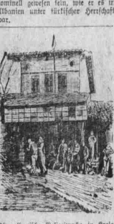
Die albanische Polizeiwache in Koscov, Albanien.

Bei der Landesverteidigung ist augenblicklich alles im Werden. Es besteht keine Wehrpflicht, doch waren einige Provinzen verpflichtet, eine bestimmte Zahl von Fußsoldat und Artillerie aufzustellen und zu unterhalten. Aus den schweifenden Stämmen kommt irreguläre Reiterei. Die Länge der Dienstzeit ist durchaus willkürlich. Bestimmungsmäßig sollte die Armee aus 80 Infanterieregimentern zu 700 bis 800 Mann bestehen, wozu 18 Regimenter und 13 Halbtompanien Artillerie mit zusammen 7000 Mann und 20,000 Säbel in angeblich 125 Regimentern irregulärer Kavallerie gehören.