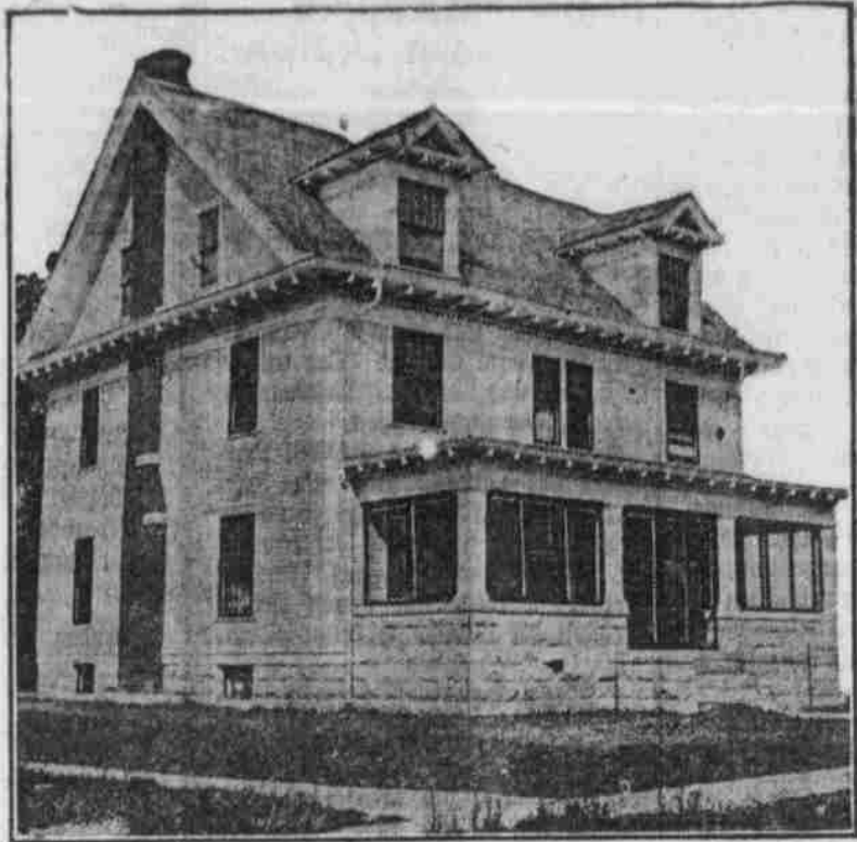
Perspektivansicht, nach einer Photographie.