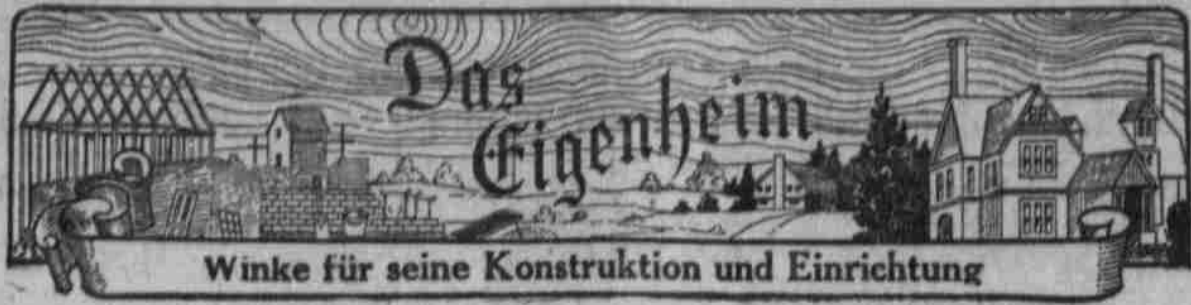
Winke für seine Konstruktion und Einrichtung

Falls Sie Ihre Haushaltsgegenstände transportieren oder aufbewahren lassen wollen, dann telefonieren Sie Douglas 394 Gordon Fireproof Warehouse & Van Co. 219 nördliche 11. Straße